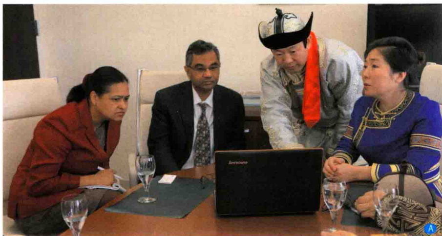
A. 作者等蒙医学专家应联合国人居署邀请在美国考察期间于2013年2月13日受世界卫生组织驻联合国大使库玛艾森（右3）接见并做蒙医蒙药介绍