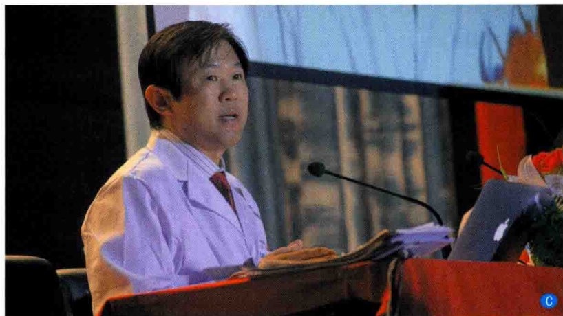
C. 2014年3月28日作者在锡林郭勒蒙医医院做健康教育讲座