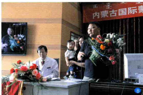
B. 2013年4月30日作者在内蒙古国际蒙医医院做心身互动治疗康复汇报