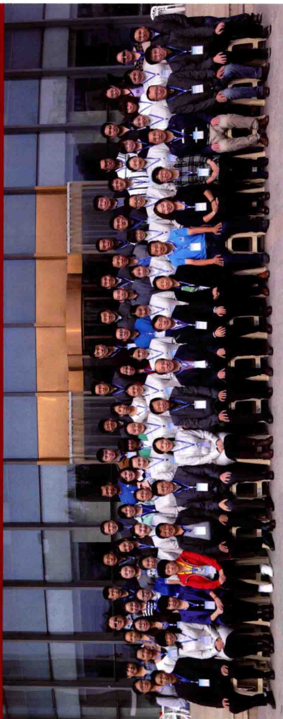
第二期蒙医心身互动疗法实用技术培训（2014年9月28日于内蒙古国际蒙医医院）