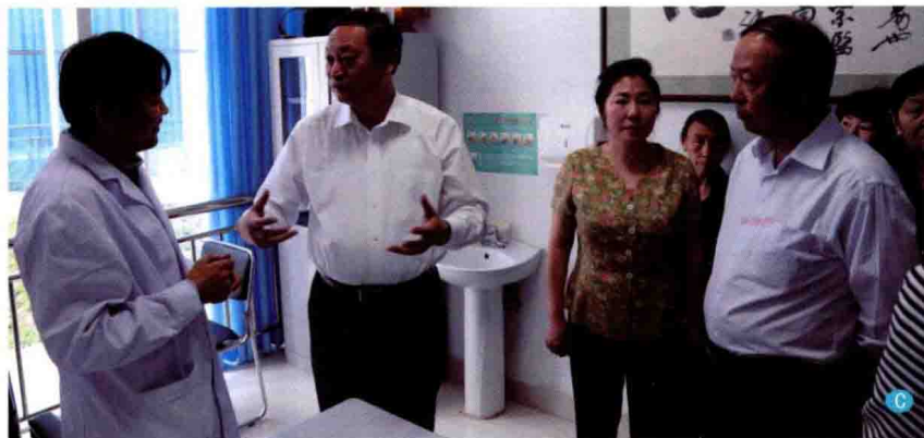
C. 国家卫计委副主任、中医药管理局局长王国强（右3）于2013年5月21日在内蒙古国际蒙医医院心身医学科考察调研