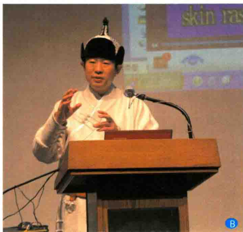
B. 作者等蒙医学专家应联合国人居署邀请在美国考察期间于2013年2月8日受美国石溪大学邀请做学术演讲