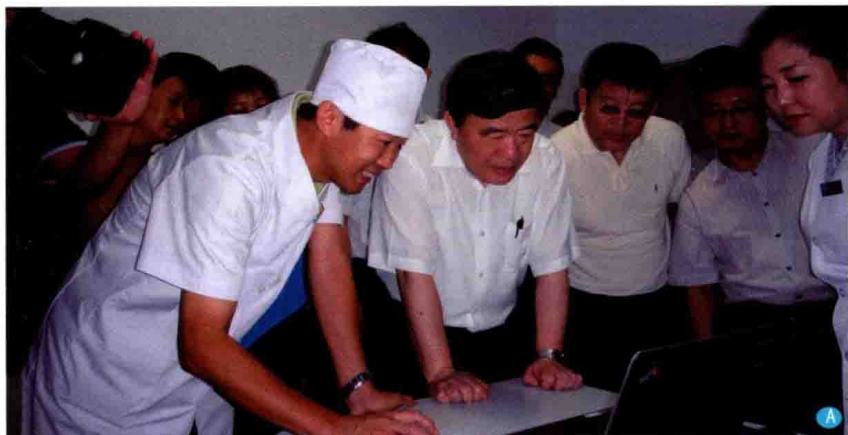
A. 全国人大副委员长、时任卫生部部长陈竺（右4）于2012年7月26日在内蒙古国际蒙医医院心身医学科考察调研