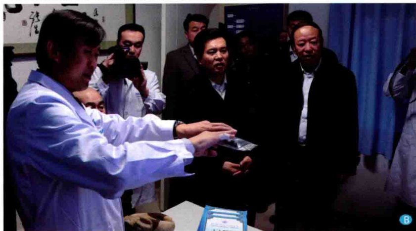
B. 全国政协副主席、国家民委主任王正伟（右3）于2014年2月17日在内蒙古国际蒙医医院心身医学科考察调研