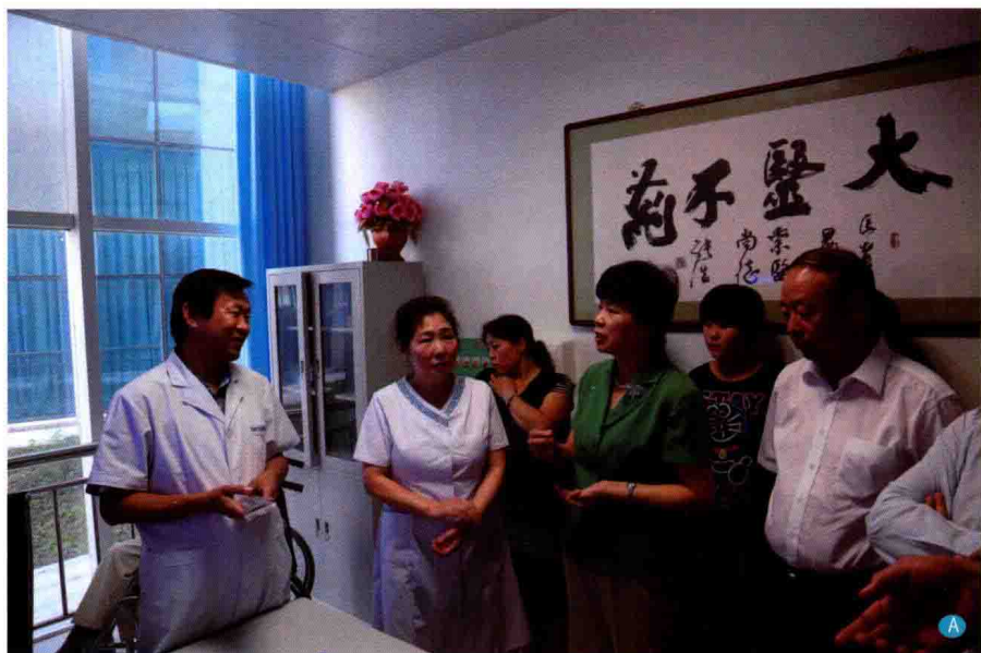
A. 国家卫计委副主任崔丽（前排右2）于2013年8月24日在内蒙古国际蒙医医院心身医学科考察调研