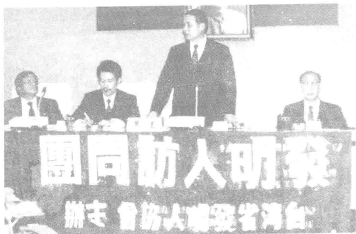
長院由，訪拜院察監往前，團問訪人明發領率（二左）者作 明發名為一左，見接生先群空馬長院副及（二右）生先秋尊黃 。角一場會為圖下，生先欽與劉家