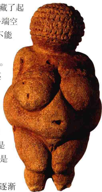
14.2 (上)《女人像(威冷道夫的维纳斯)》。约公元前23000年。石灰石，高11.1厘米。自然历史博物馆，维也纳

引人入胜的新石器时代日常生活片断在非洲北部阿尔及利亚的阿杰尔高原地区的岩画（14.3）中保存了下来。今天的阿杰尔高原是世界上最大的沙漠——撒哈拉大沙漠的一部分。