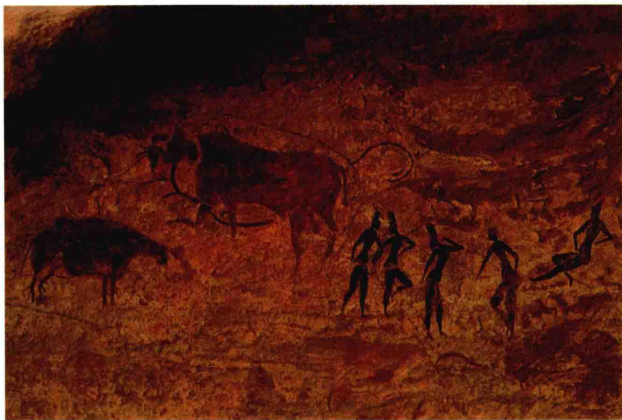
14.3 (下)《女人与牛》。岩画，阿杰尔高原的塔西利，阿尔及利亚。田园风格，公元前5000年之后