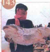
博斯腾湖鲤鱼 博斯腾湖草鱼