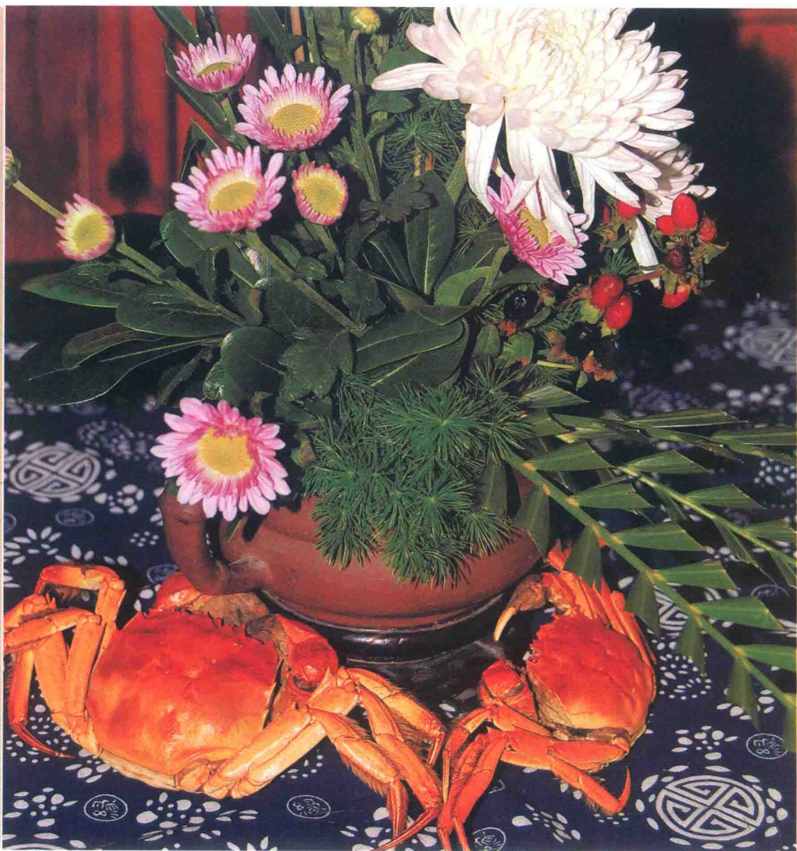
· 菊自芬芳蟹有香