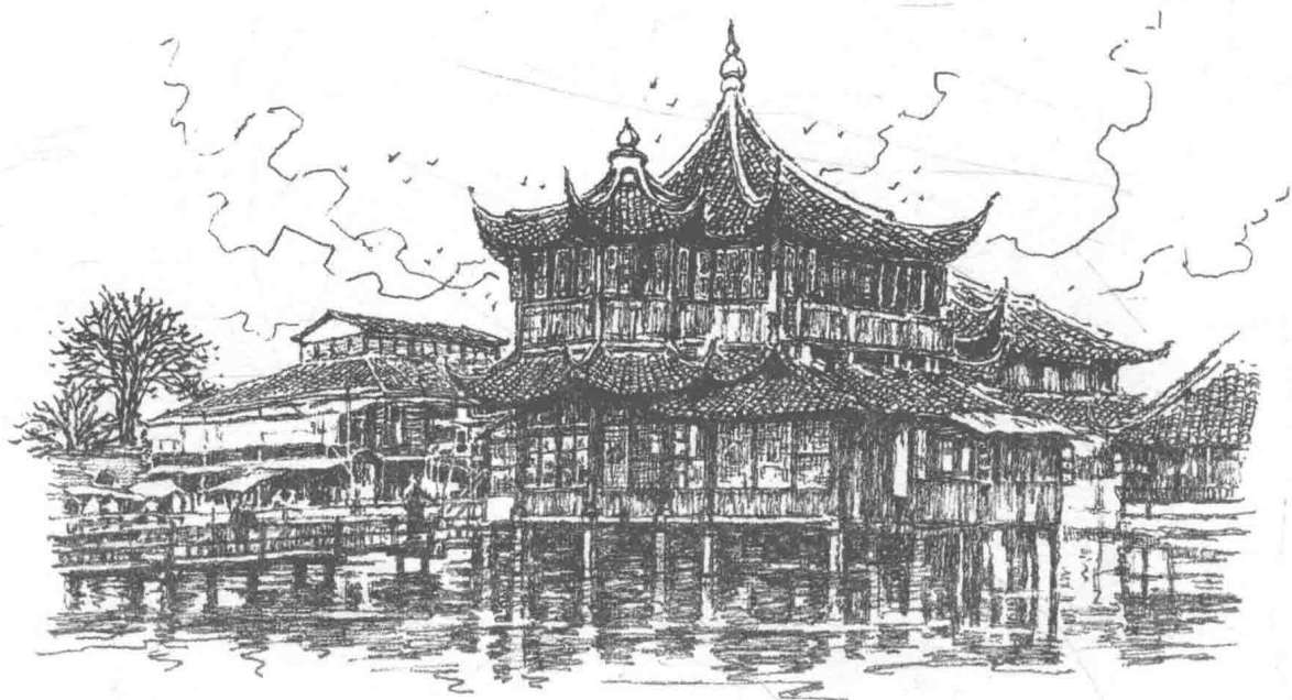
豫园 2013.10. 画家画于海上名城

This garden fully demonstrates the architectural style and design of the Chinese classical gardens. Address: No.132, Anren Street.