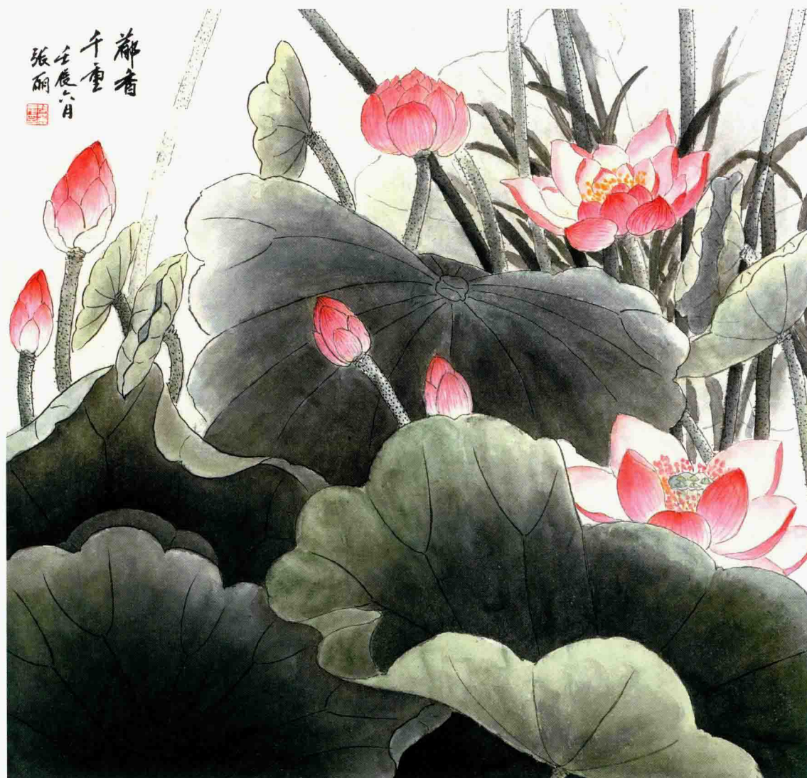
郁香千重 91cm×93cm 2012年