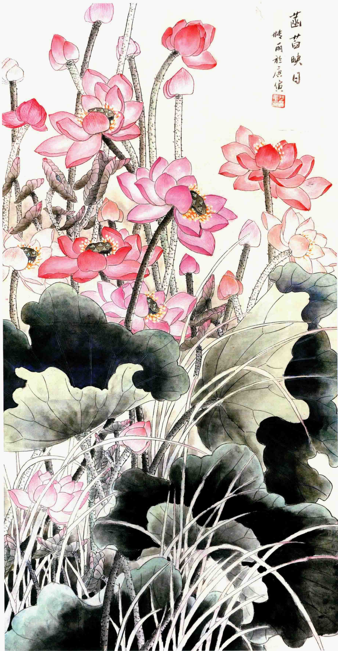
菡萏映日 136cm X 68cm 2010年