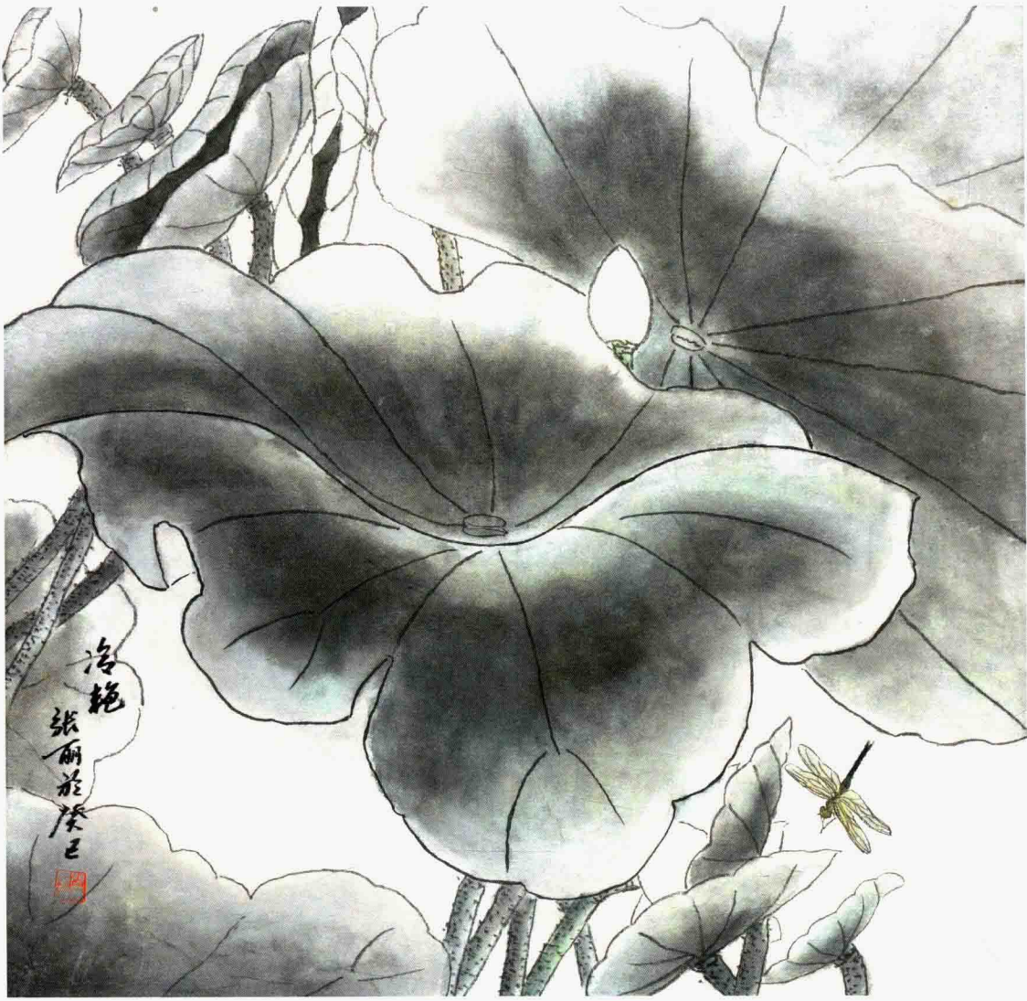
冷艳 68cm×68cm 2013年