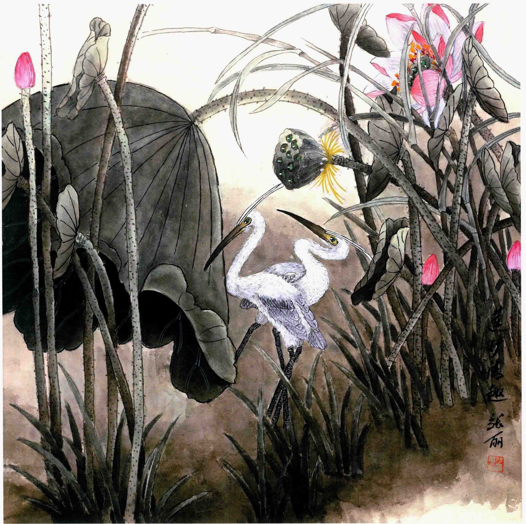
莲塘清趣 68cm×68cm 2012年