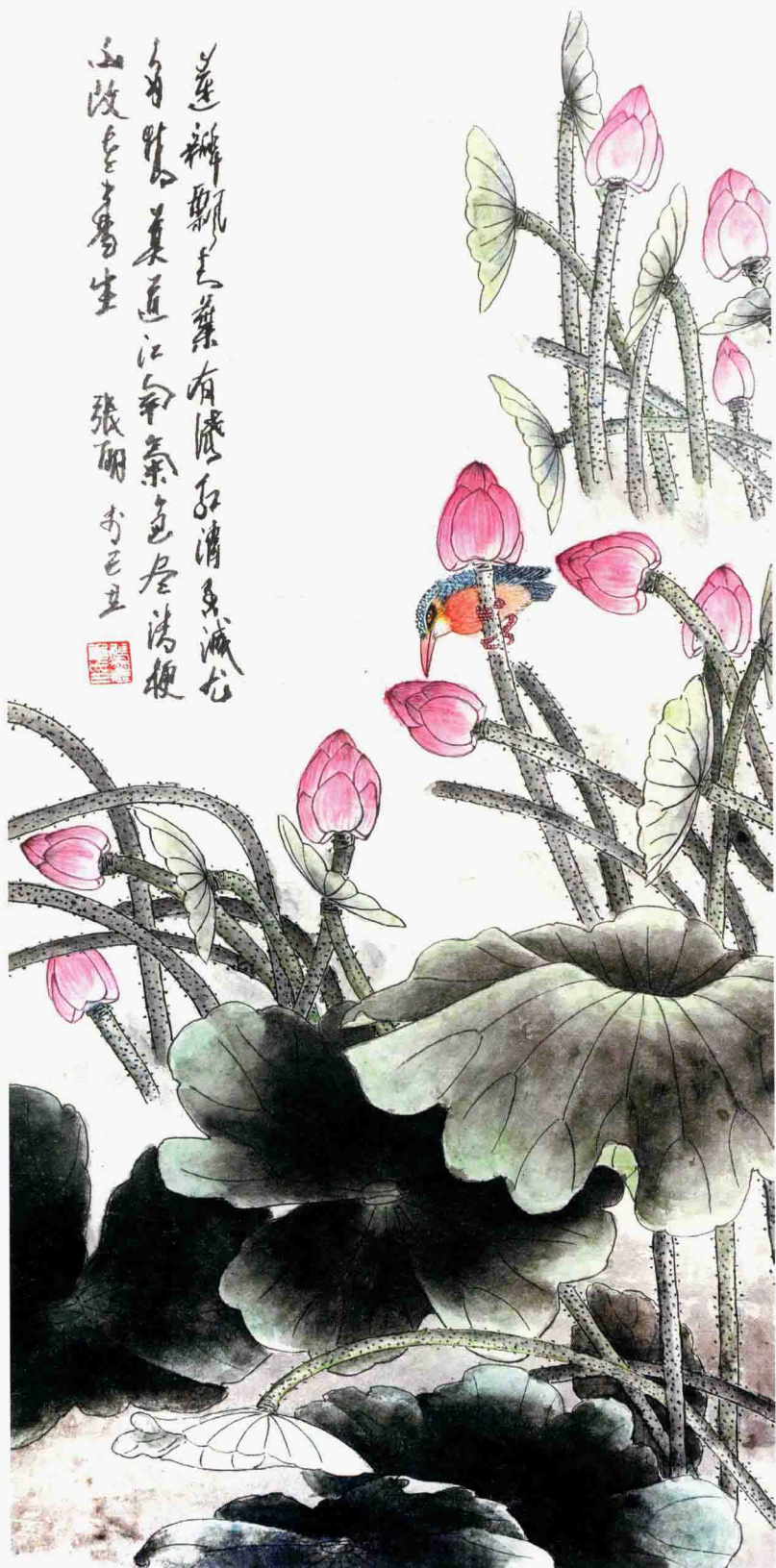
蓮瓣飄動 95cm×46cm 2009年