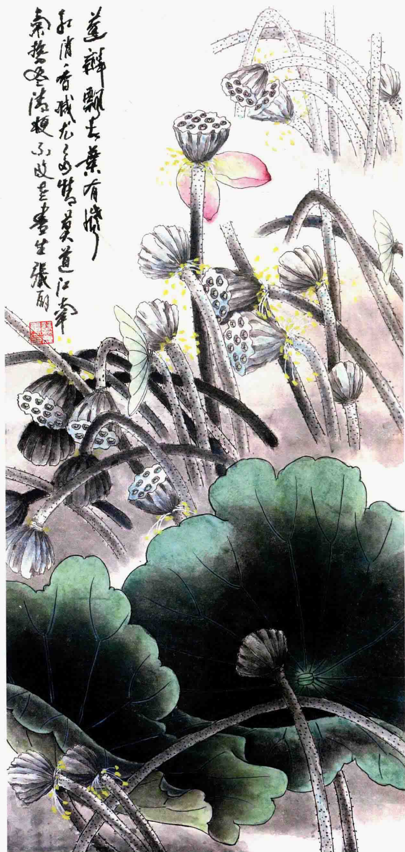
莲瓣飘动 95cm×46cm 2009年