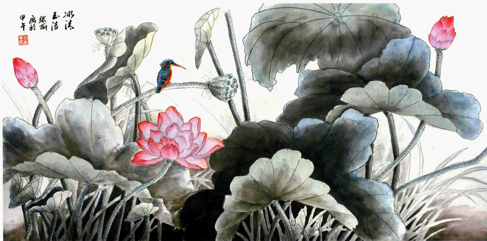
冰清玉洁 66cm×133cm 2014年