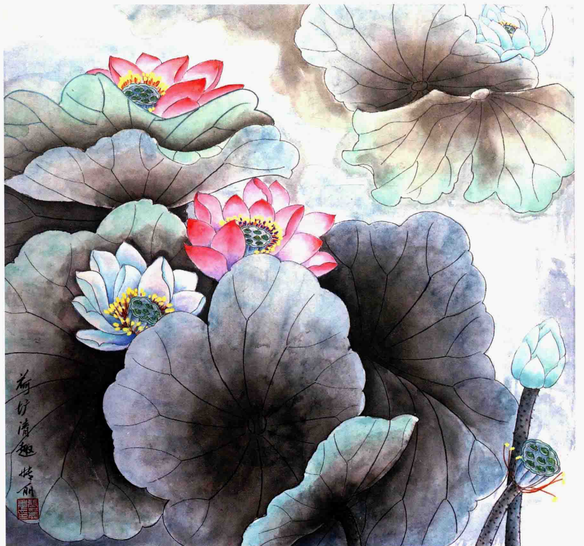
荷塘清趣 66cm×67cm 2008年