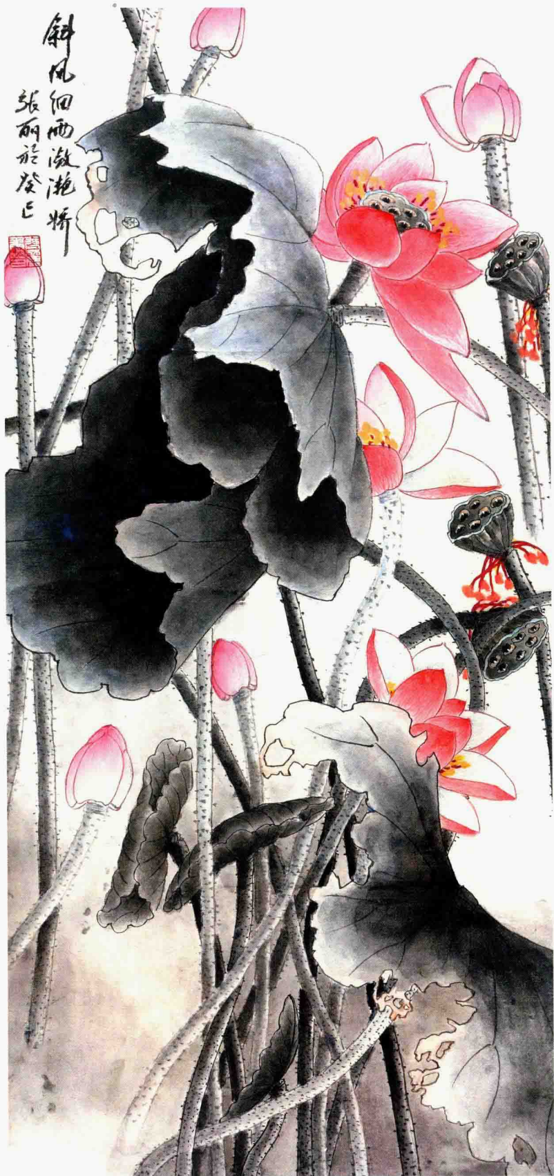
斜风细雨潋滟娇 95cm×46cm 2013年