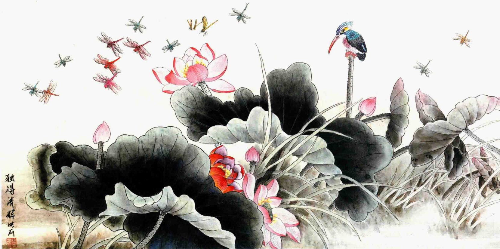
独得清辉 67cm×133cm 2009年