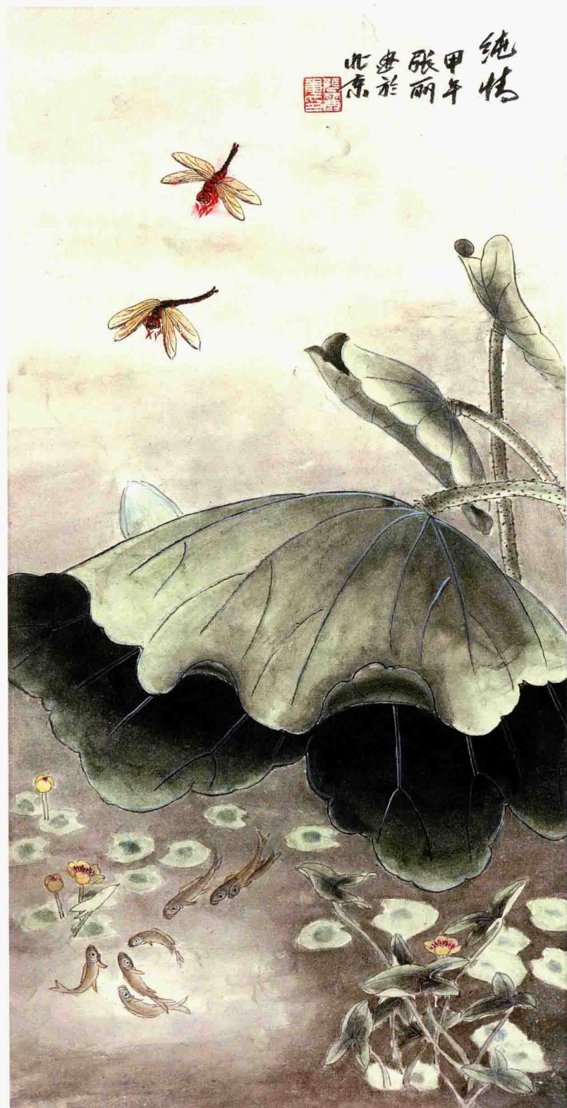
纯情 79cm×36cm 2014年