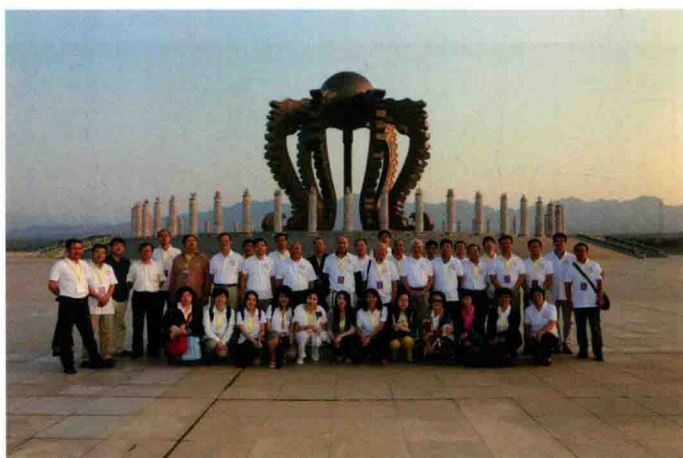
与会代表在中华合符坛合影