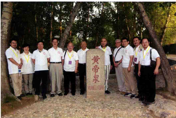
与会代表考察“黄帝泉”遗址留影