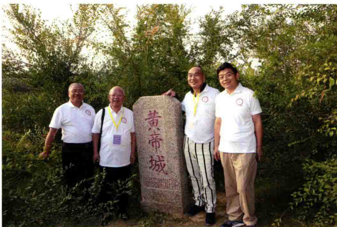
与会代表考察“黄帝城”遗址