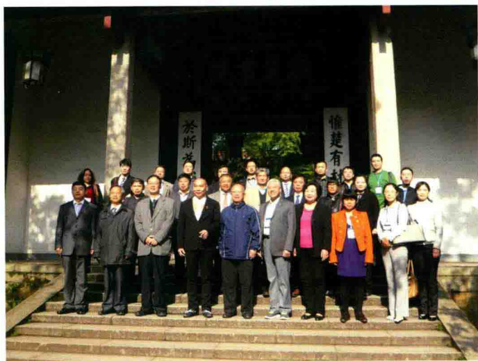
2013年4月在湖南大学举办的“黄帝思想与道、理、法” 国际研讨会与会代表在岳麓书院前合影