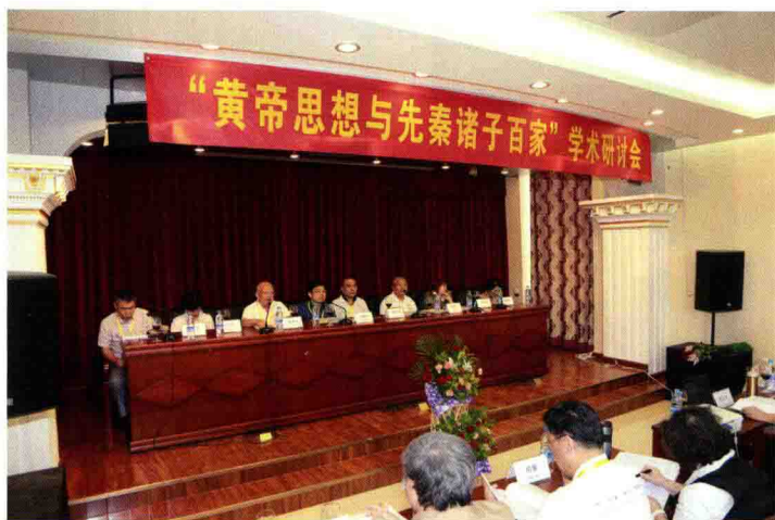
2014年9月“黄帝思想与先秦诸子百家”学术研讨会在河北涿鹿“黄帝城”召开