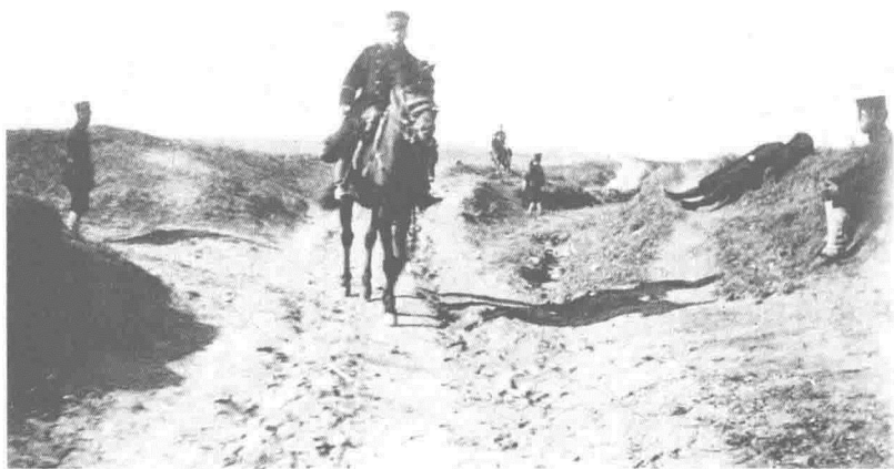
日军在花园口登陆

9月下旬,日军攻入中国境内。当时守江的清军有近4万人,一闻有警,竟全线崩溃,日军轻易地占领了沿江的丹东、九连城等地,并向辽阳进军,威逼沈阳,整个辽东半岛大为震动。