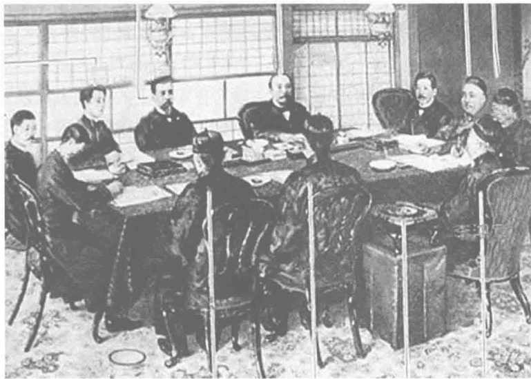
马关条约签约现场

此后,辽东半岛虽因俄、德、法三国出面干涉而归还中国,但日本政府却又从清政府手里讹诈去 3000 万两白银。台湾则因日本军国主义侵略势力的长期介入,至今仍然成为关乎地区稳定的热点之一。