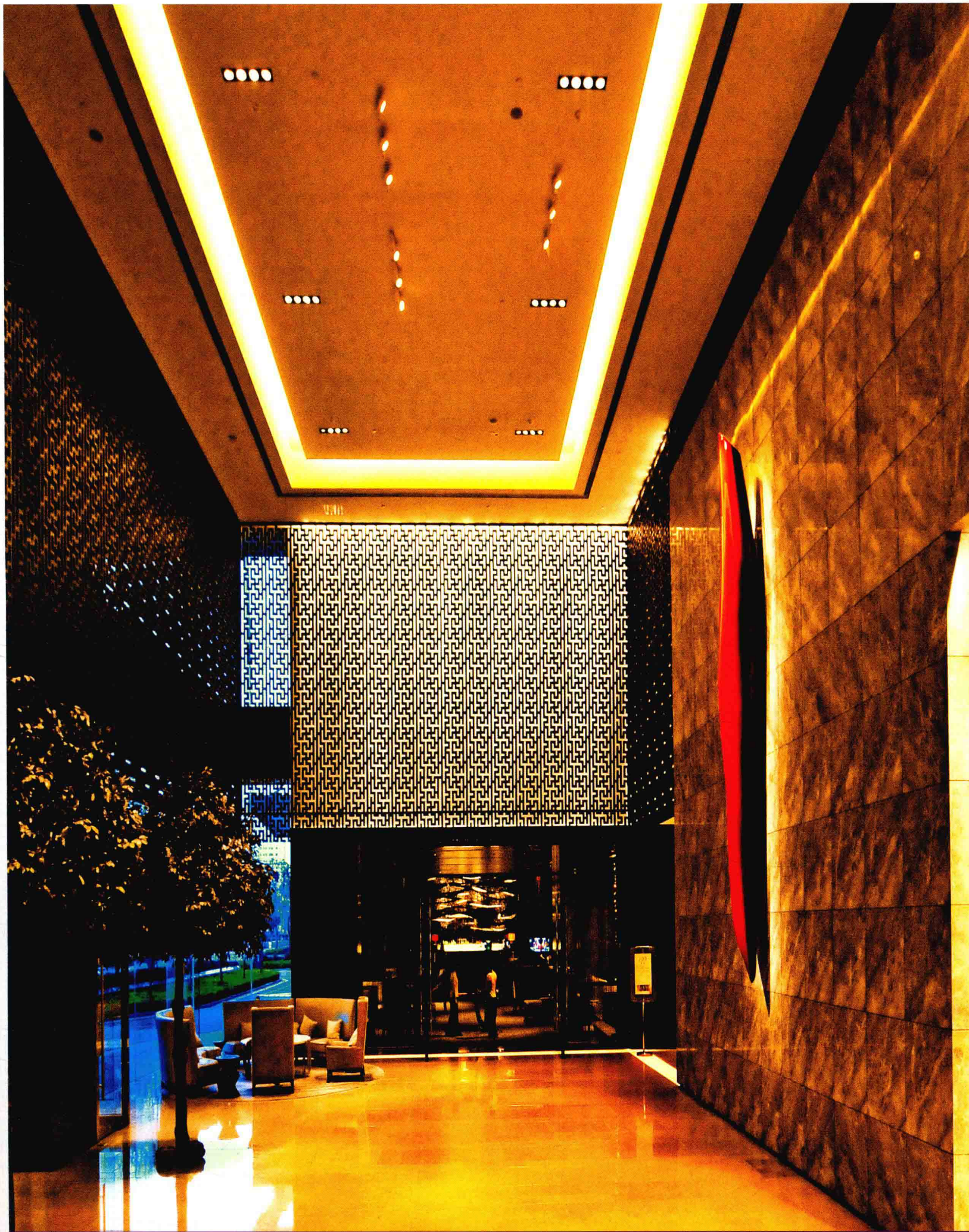
↑ 酒店大堂，优雅与奢华 / The hotel lobby, elegance and luxury.