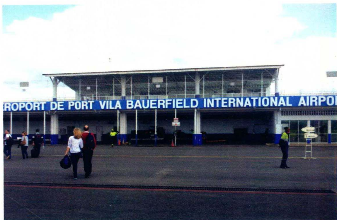
维拉港国际机场