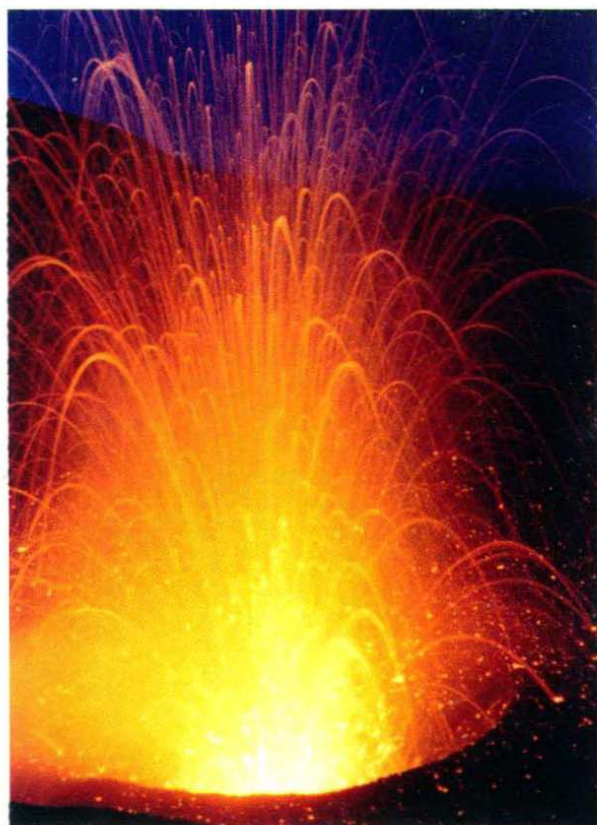
上帝燃放的礼花：伊苏尔火山