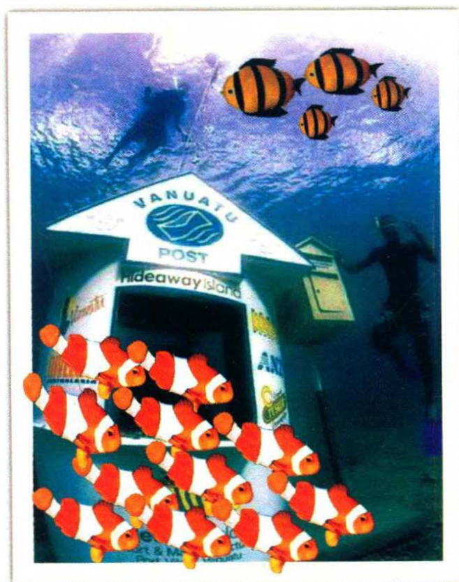
水下邮局