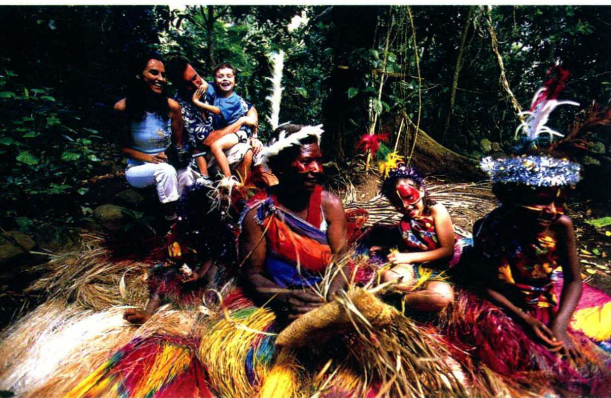
编织草垫