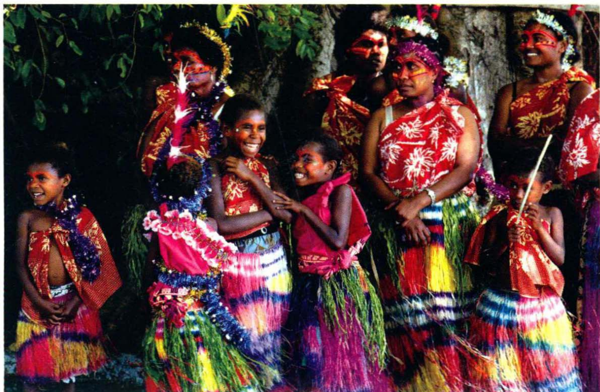
盛装的瓦努阿图妇女和儿童