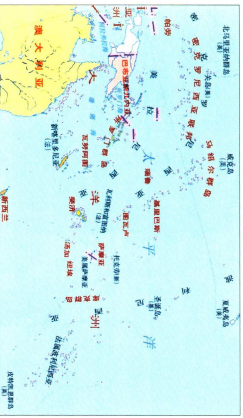
太平洋主要岛屿位置图