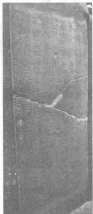
图 1-5 宋重刻“峯山刻石”

此“峯山刻石”为秦始皇巡行途中所立的第一个刻石，也可以视为我国历史上最早的纪功刻石。此后又立泰山刻石、琅琊台刻石、之罘刻石、东观刻石、碣石刻石、会稽山刻石，共七大刻石，形成了两千余年来中国书法表现史上的一种重要形式。秦刻石上所刻字体为秦统一文字后使用的秦篆，即小篆。（图 1-5、图 1-6）