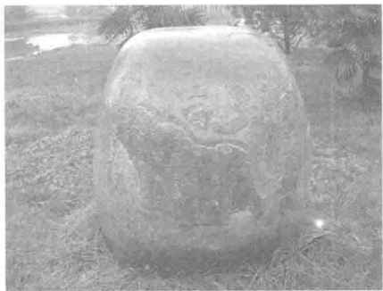
图 1-4 石鼓（复制品）

张怀瓘之《书断》。因其内容主要是记叙贵族游猎之事，故又称“猎碣”。根据其出土处说法的几种不同版本，又有“陈仓十碣”“雍邑刻石”“岐阳石鼓”等名称。石鼓上所刻字体为秦始皇统一文字前的大篆，即籀文。（图 1-4）