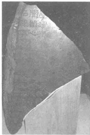
图 1-7 东汉《熹平石经》残碑

东汉时期，盛行门生故吏竞相为其府主歌功颂德之风，形成了“碑碣云起”的盛况。《张迁碑》《衡方碑》《曹全碑》《史晨碑》等都是不同风格隶书的代表性碑石。另一类石刻则是用以记录劈山开路、修治水利等重大工程的摩崖石刻，著名的如《石门颂》《西狭颂》等。此外，由蔡邕等倡议发起，并用标准八分隶书书写的《熹平石经》则是石刻经书的典范之作，据说石经立成后，每天前来观看及摹写者所乘坐的车舆达一千多辆。（图 1-7）