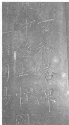
图 1-8 唐柳公权《玄秘塔碑》

唐代是碑版石刻最为繁荣的时代，这一时期的石刻作品数量众多，冠绝古今。唐碑已具备了各体书法，但以正楷为主，故书法史上有“秦篆、汉隶、唐楷”之说。欧阳询 76 岁所书《九成宫醴泉铭》（简称《九成宫碑》）被誉为千余年来楷书登峰造极之作，“唐楷第一”。唐代另外两位家喻户晓的楷书名家是颜真卿、柳公权，“颜筋柳骨”的书法风格，真正可谓珠联璧合。颜真卿的《多宝塔碑》、柳公权的《玄秘塔碑》分别是其风格的代表之作。（图 1-8）