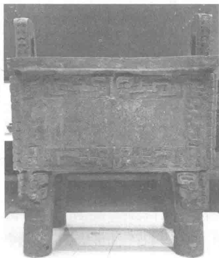
图 1-2 后母戊鼎

商代的金文铭辞字数较少，如目前已出土的最大青铜器“后母戊鼎”（曾名“司母戊鼎”）的腹内壁仅有铭文“后（司）母戊”三字（图 1-2）。而西周时期的青铜铭文得到了高度发展，其中铭文最长的毛公鼎达 497 字（一说 499 字），记叙了周宣王册命诰勉其臣毛公奭（yīn）的词句，其铭文气势宏伟、结体庄重，线条质感饱满丰腴、圆转肥厚，是金文书法的一篇典范之作。