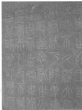
图 1-6 清重刻“会稽山刻石”