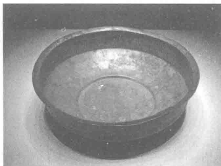
图 1-3 西汉“医工”铭文（见左侧）铜盆

金文中的医药内容较为少见，历史上主要有两件与医药有关的铜器：一件是汉代的医工铜盆，出土于河北满城汉墓，铸有“医工”二字铭文（图 1-3）；另一件是北宋王惟一主持铸造的针灸铜人，体表上铸有穴位名称。严格地说，这两件器物只能是算医学文物，称不上真正的医药文献。