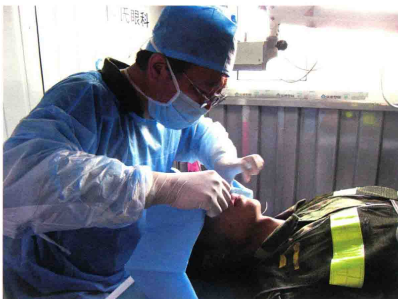
2008年，汶川地震后，在汶川抢救眼外伤小战士