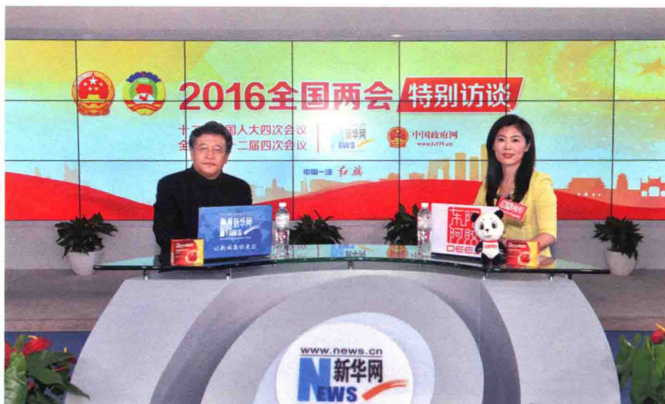
2016年两会中，接受新华网采访