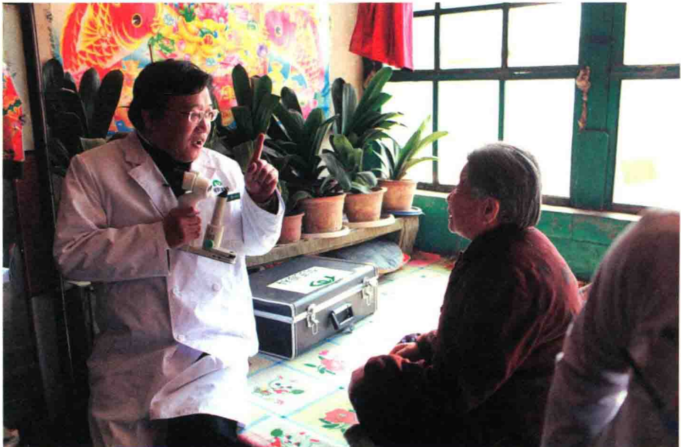
2012年2月19日，携医疗队走进盖州贫困眼病家中为其进行眼部检查