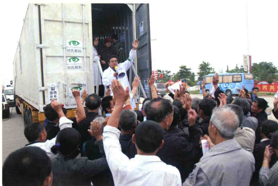
长达16米的爱心流动车满载救灾物资，并配备高精尖设备为当地百姓做眼科手术