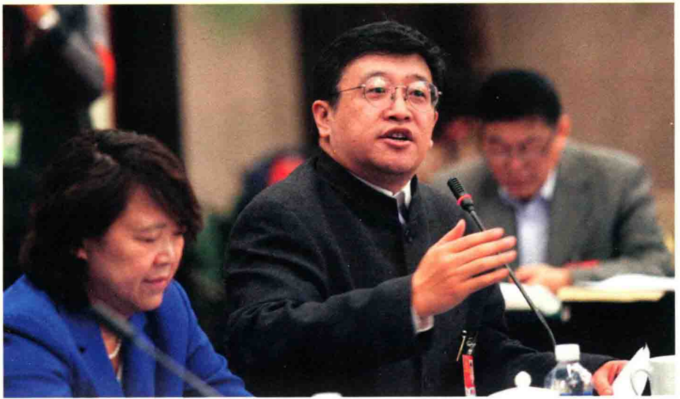
2013年，全国政协第十二届一次会议，参加医卫组讨论