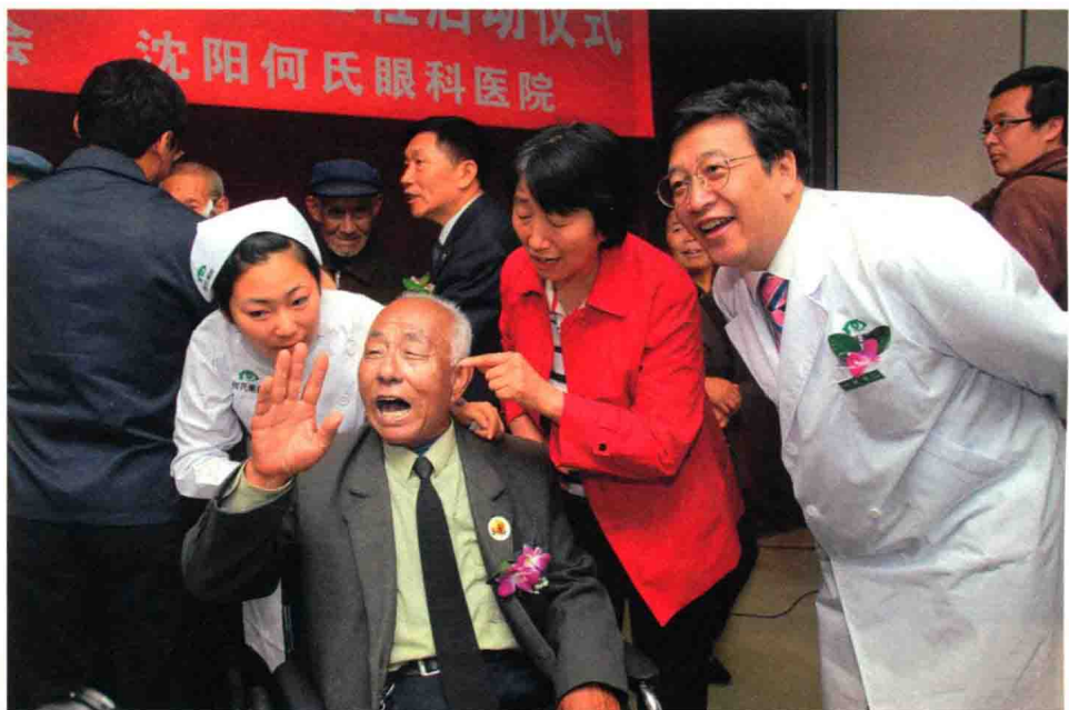
2008年5月，何氏眼科沈阳医院与辽宁省民政厅、辽宁省慈善总会共同开展关爱功臣——“三老”白内障复明工程