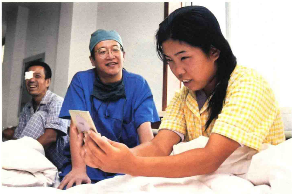
2004年，为一家三口在同一天做了免费复明手术