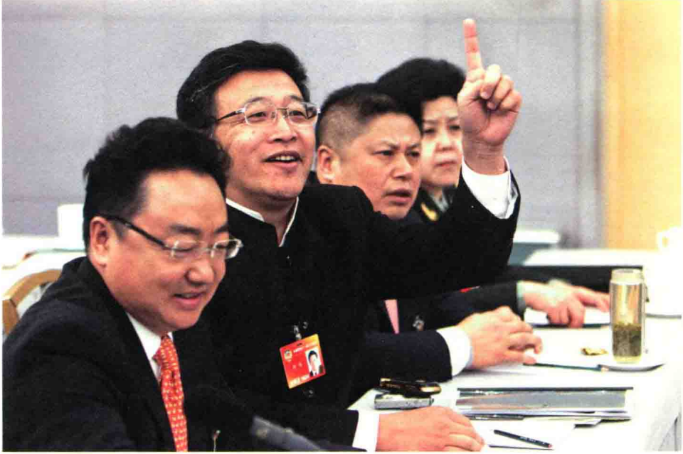
“请给我一分钟。”2010年，参加全国政协第十一届三次会议的分组发言