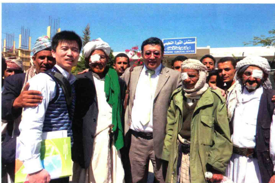
何氏眼科作为中国政府国际民间外交的支持单位，多次接受国际眼科义诊和援助工作