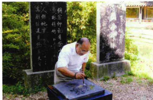
2006年7月在绍兴兰亭碑林前临摹王羲之 书体“鹅”字