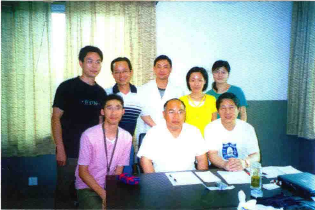
2005年6月与学生们在诊室合影