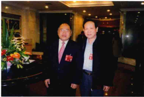
2003年3月与全国政协委员、著名 心血管专家李天德教授合影