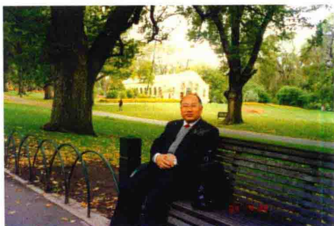
2004年4月在澳大利亚访问时留影