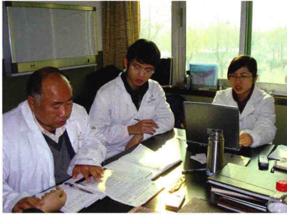
2008年门诊带教研究生