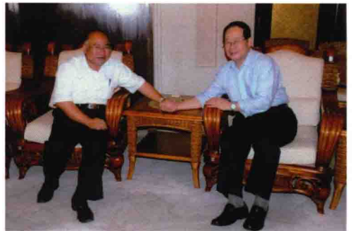
2007年9月为全国政协副主席张怀西诊脉