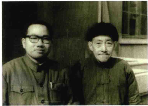
1979年看望著名中医学家沈仲圭先生时合影