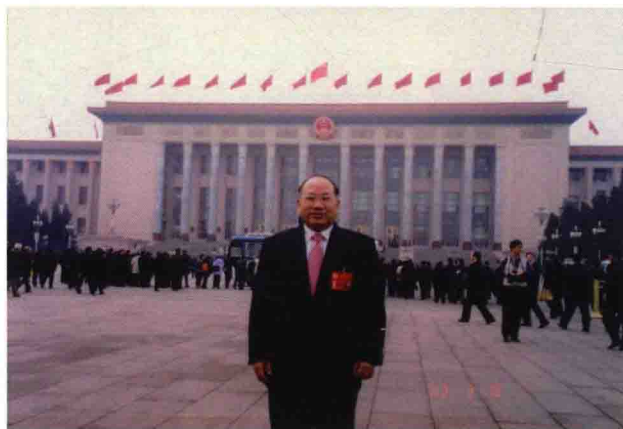
2003年3月参加全国政协十届一次会议