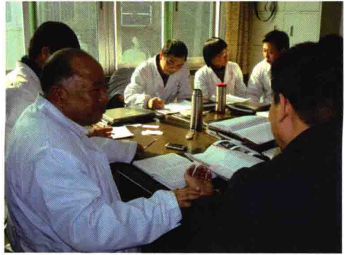
2008年临床带教研究生