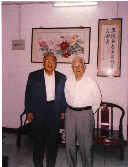
2006年10月与邓铁涛教授合影于广州邓府