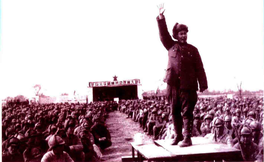
▲十九兵团司令员杨得志在授番号大会上号召部队将革命进行到底。