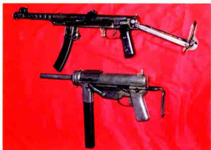
▲任山河战斗中曾使用过的冲锋枪。