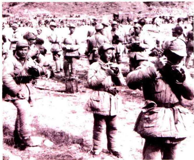
◀行军途中六十四军某部指战员野外露餐。