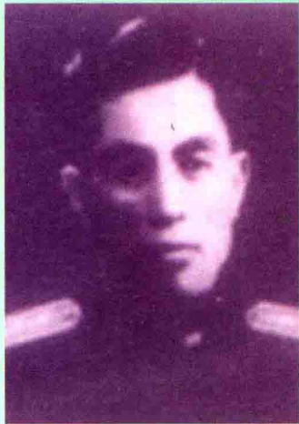
▶原一九二师副师长孙树峰。