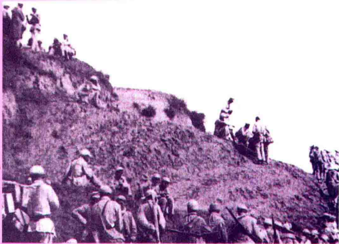
▶六十四军某部进行任山河战斗前的准备工作。