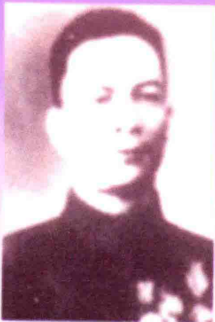
◀原一九二师副政委罗立斌。