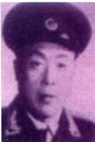
◀原一九一师参谋长汪应中。