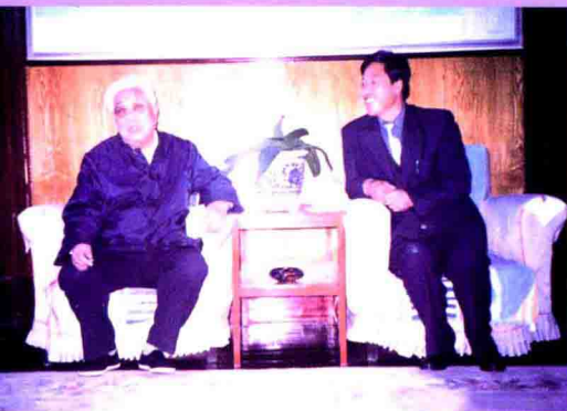
▲彭阳县民政局局长张凤刚访问张怀瑞将军。