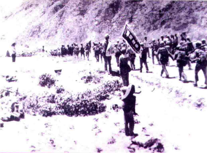
◀挺进彭阳途中的一九一师五七三团指战员。