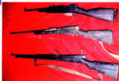
▲任山河战斗中曾使用过的步枪。