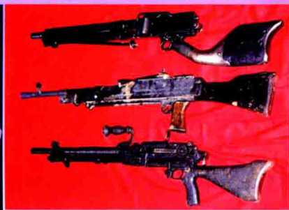
▲任山河战斗中曾使用过的轻机枪。