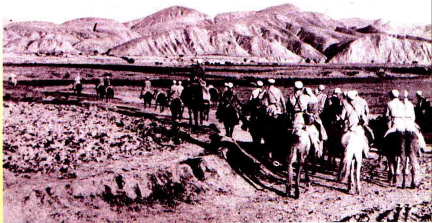
▶六十四军骑兵一部。