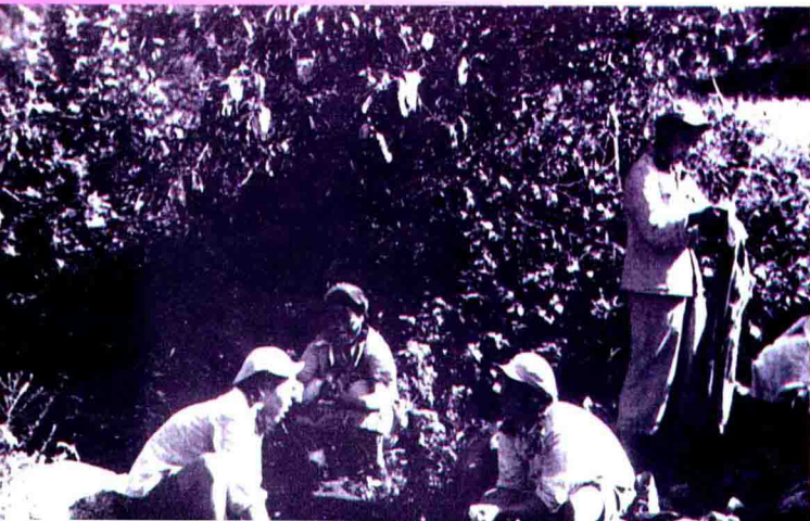
◀六十四军文工团队员为伤病员洗衣服。