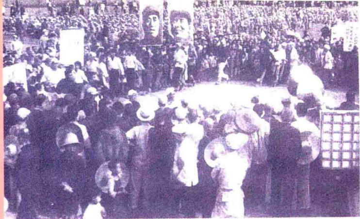
▲1949年8月12日固原军民欢庆解放。