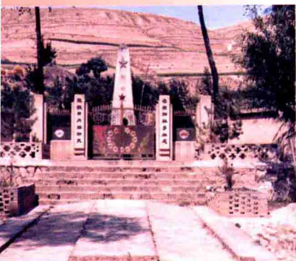
▲1955年修建的烈士陵园大门。