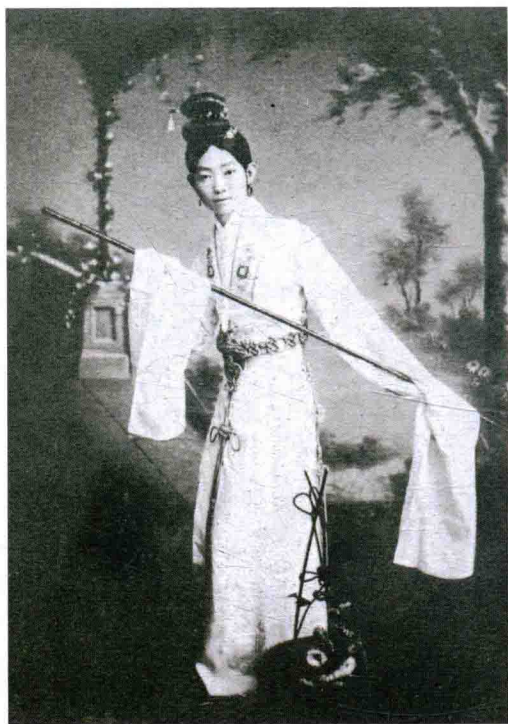
1920年,《梅欧阁诗录》登载《嫦娥奔月》剧照