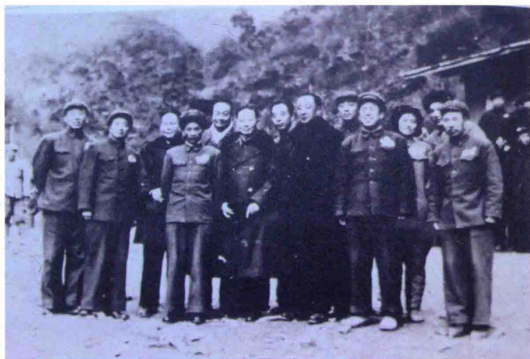
梅兰芳、周信芳、程砚秋、马连良等在朝鲜与志愿军官兵合影