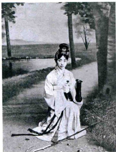
1920年,《梅欧阁诗录》登载《黛玉葬花》剧照