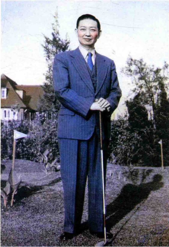
1947年，梅兰芳在上海沪西俱乐部打高尔夫球