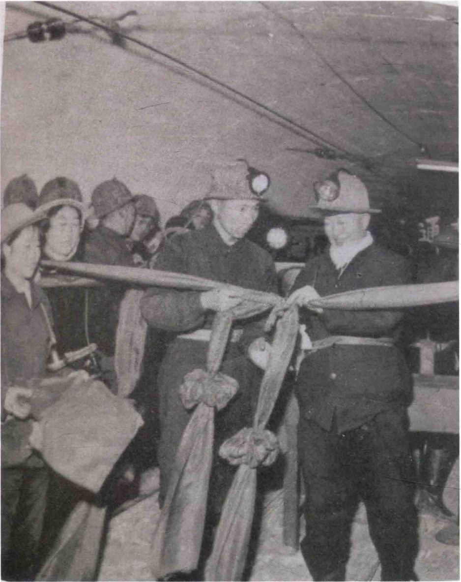
在京西矿区井下，参加地下通车典礼活动