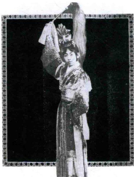
1927年,《梅兰芳》登载《上元夫人》剧照