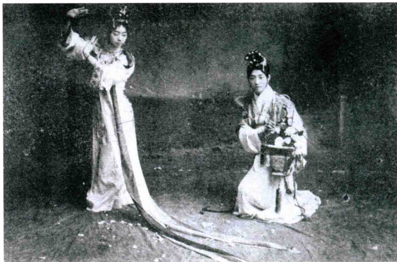
1919年,《支那剧与梅兰芳》登载《天女散花》梅兰芳、姚玉芙剧照