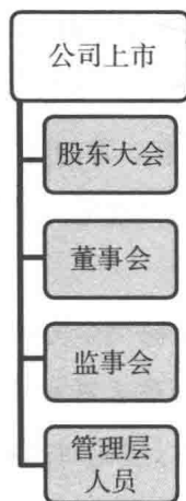
图 1-3 上市公司的组织机构

公司一旦上市，就成为了公众的公司，会建立股东大会、董事会、监事会、管理层等法人治理结构。同时，公司还会引入独立董事、审计部等监督机构。这样的公司会成为一个具有国际化特征的规范化公司，各方面机制机构也都需要健全（图 1-3）。