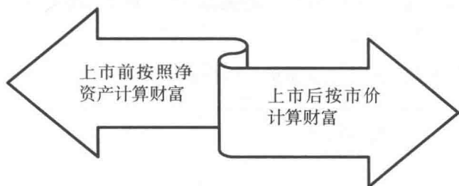
图 1-4 公司上市前后股东价值的变化

公司上市之后，股东价值由原来按照净资产来计算，转变为按照市价来计算（图 1-4）。同时，这种资产还可以流通。因此对股东来说，他们的财富大大增加了。