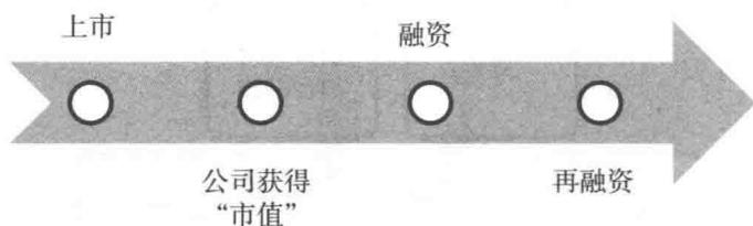
图 1-2 企业上市融资流程