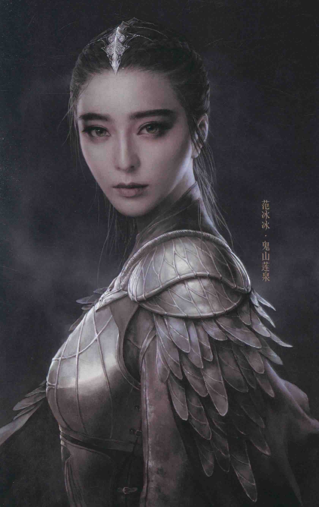
范冰冰 · 鬼山莲泉