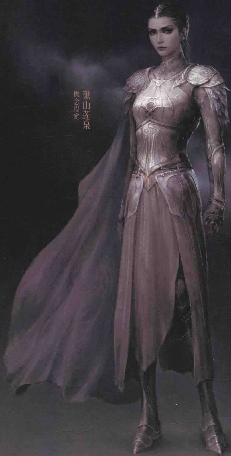
鬼山莲泉 概念设定