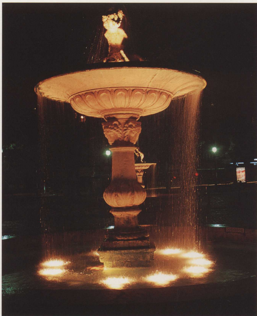
●台北凱悅飯店前的噴水池〔下〕

品的主體，也可與建物、雕塑、植物或其他藝術品相結合，創造出獨具風格的作品，因此水景在公共藝術的範疇裡，應該占有重要的一席之地。因為早期水景大多與藝術品相搭配，所以其演變也是由傳統的著重觀賞的雕像或神像噴泉、水池，進入與抽象造形相結合的水景，再進到與周遭環境相配合的水景，以及能夠讓人親近接觸的親水性水景。本書將對於不同場合、地點的水景作介紹，並且將國內與國外的一些水景案例相比較，期望大家對水景公共藝術有更多一層的認識。