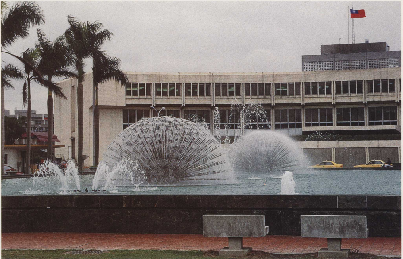
●水可以單獨作為藝術品的主體，此為台北松山機場前的噴水池。

公共藝術的觀念，於八十年代開始在台灣萌芽，官方的公共藝術政策制定和私人企業對於公共藝術的認識與資助，尚處於起步階段，而西方美國國家推行公共藝術早已有一段時日，早期的公共藝術多半與宗教或統治權力有關，教會或主權者做出決定，而藝術家則受命替宗教或帝王服務，貢獻其心智及技能。