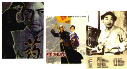
根据鲁迅作品改编的电影《药》《祥林嫂》 《阿 Q 正传》