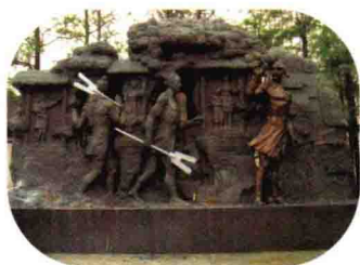
大禹“三过家门而不入”的雕塑