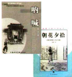
鲁迅小说集《呐喊》、散文集《朝花夕拾》