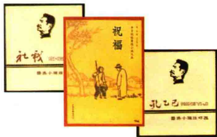
鲁迅小说的连环画《社戏》《祝福》 《孔乙己》