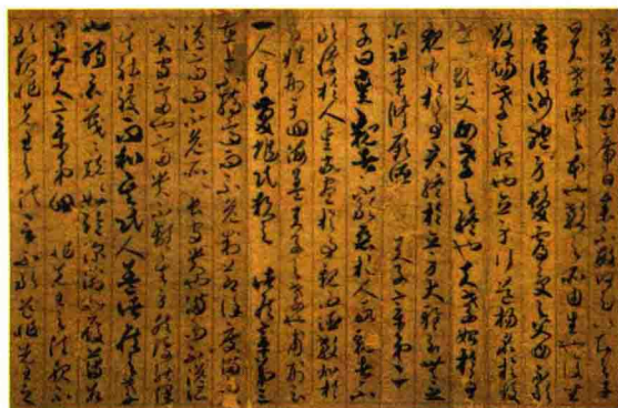
贺知章用草书抄写的《孝经》