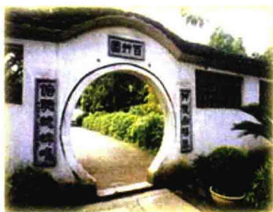
百草园。鲁迅在这里度过了快乐的少年时光