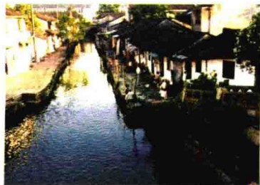
鲁迅外婆家绍兴安桥头村