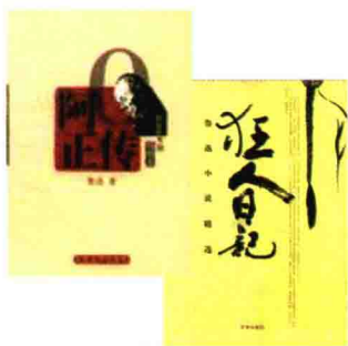
鲁迅小说《阿 Q 正传》《狂人日记》