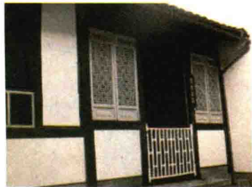
绍兴新台门周家。1881年9月25日,鲁迅诞生在这里