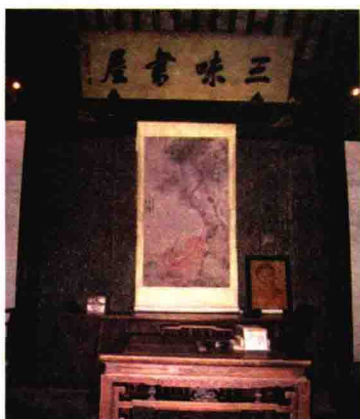
三味书屋。鲁迅 12 岁起就在这里读书,共学习了 5 年