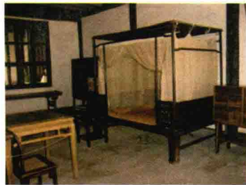
鲁迅小时候的卧室