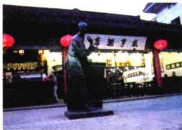
鲁迅小说《孔乙己》中写到的咸亨酒店