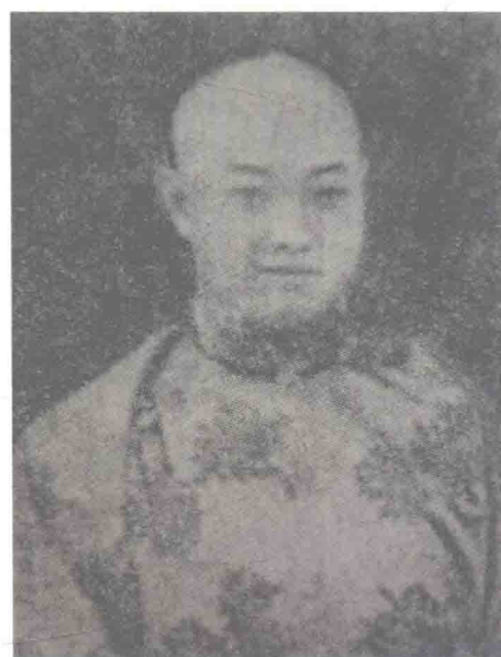
梅兰芳父亲梅竹芬