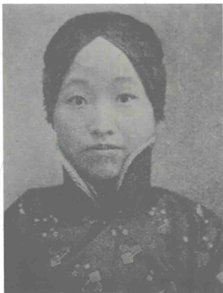
梅兰芳第一任夫人王明华