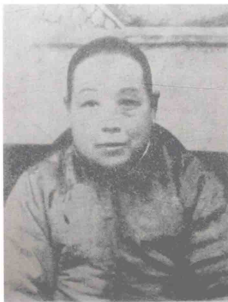
梅兰芳伯母，胡喜禄侄女