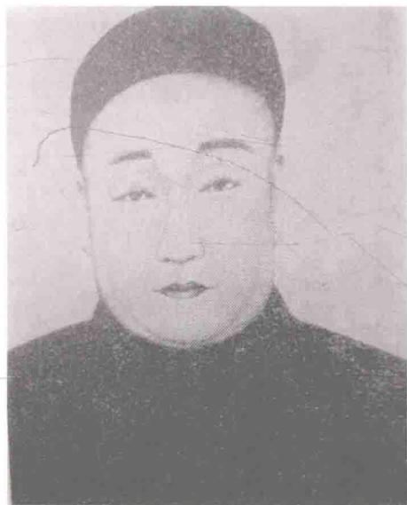
梅兰芳祖父梅巧玲