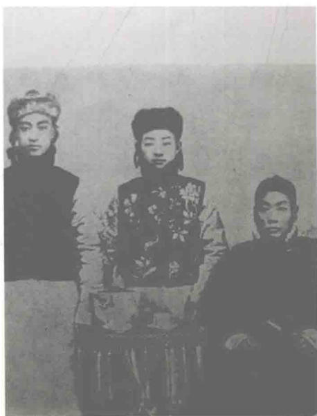
朱幼芬、梅兰芳、吴菱仙