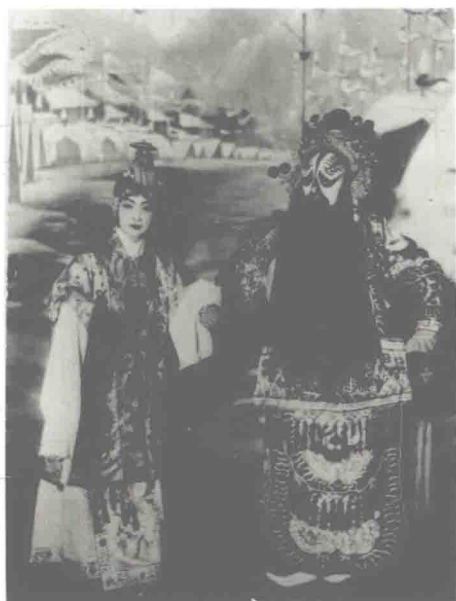
梅兰芳、杨小楼演出《霸王别姬》，1920年代