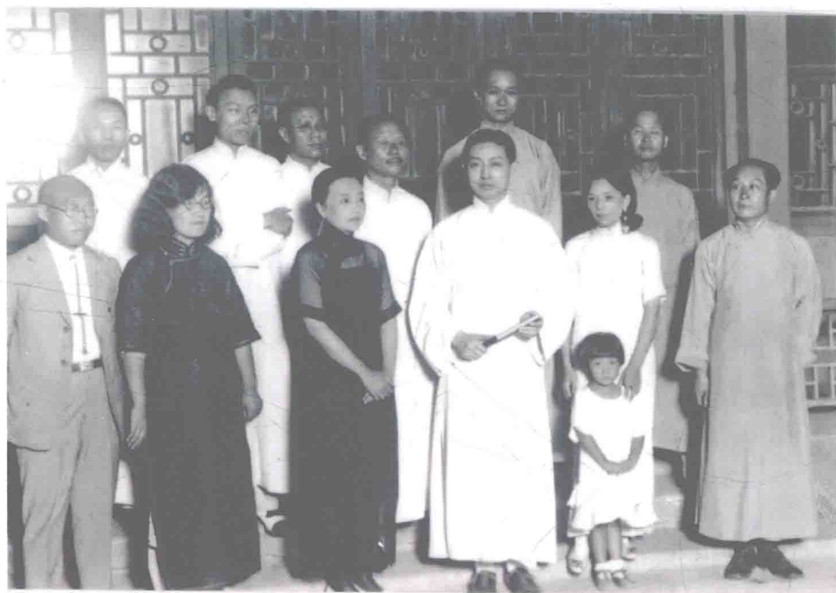
梅兰芳收陶默庵为徒合影