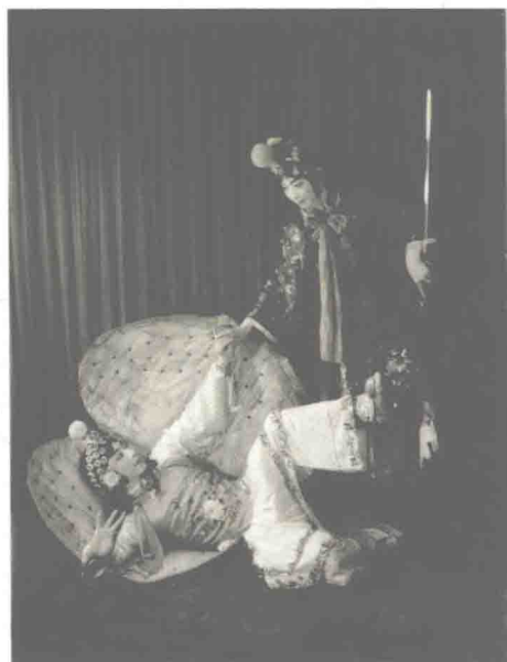
梅兰芳、朱桂芳演出《廉锦枫·刺蚌》，1928年前后