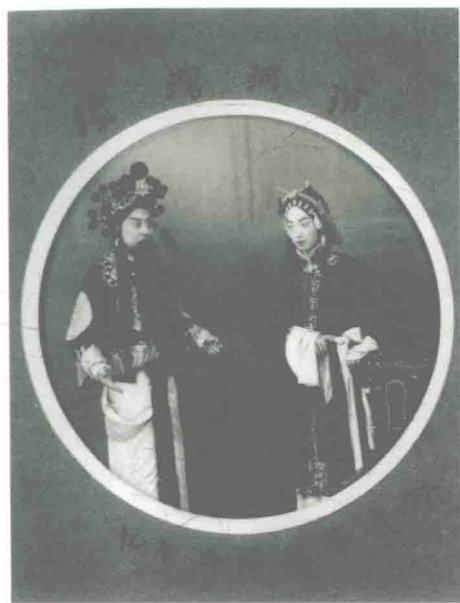
梅兰芳随王凤卿第一次赴上海演出《汾河湾》