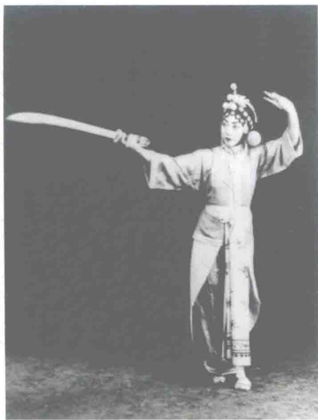
梅兰芳演出《打渔杀家》，1920年