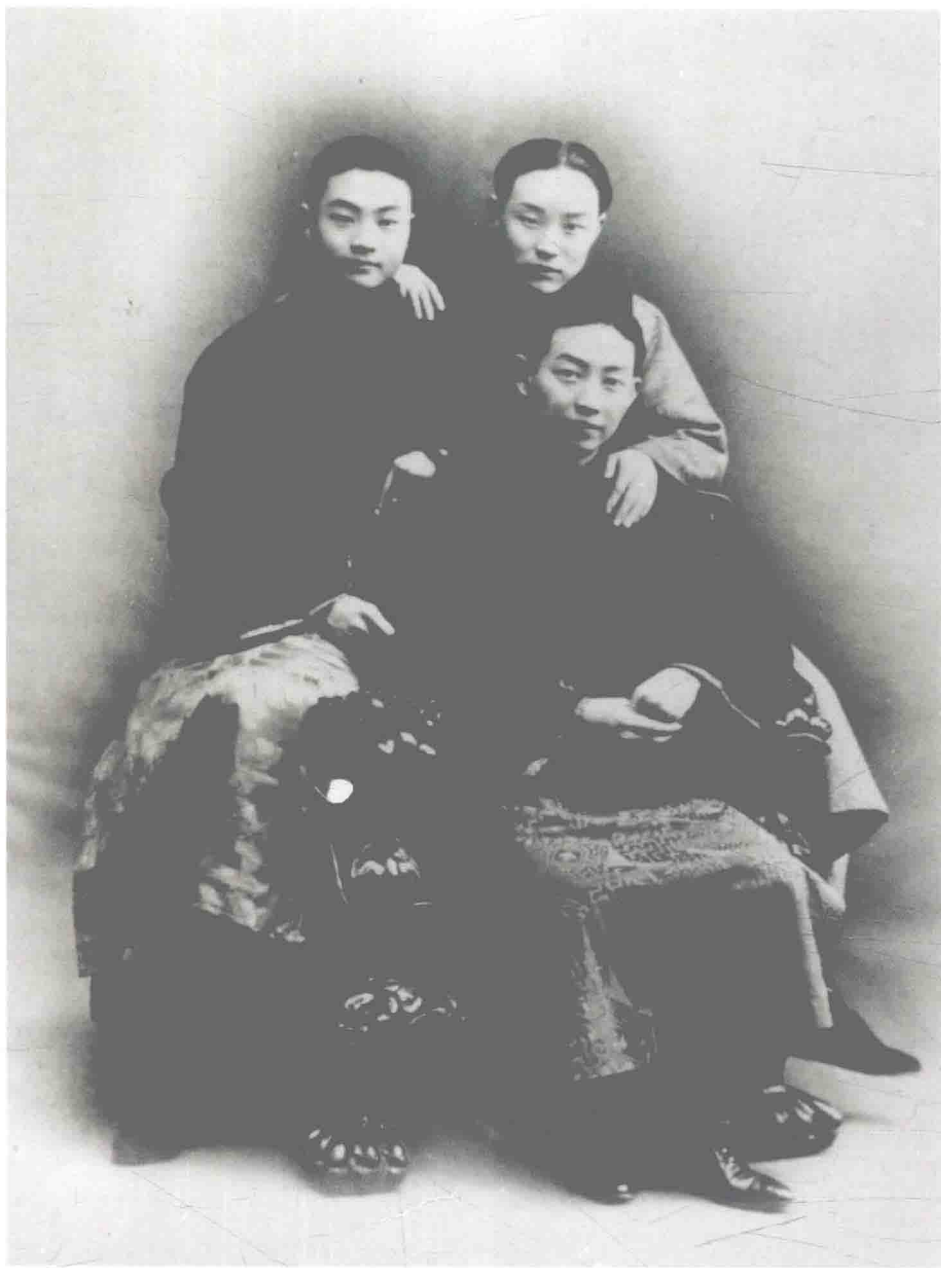
程艳秋、高小云、梅兰芳，1929年