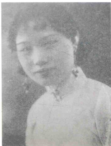
梅兰芳夫人福芝芳