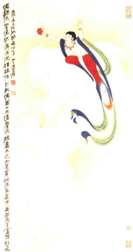
图 1-4 天女散花轴 张大千摹