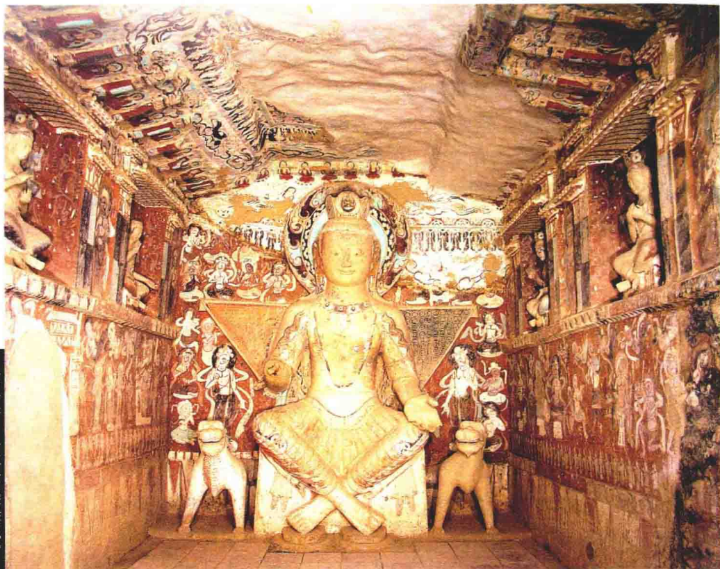
图 1-1 莫高窟第 275 窟交脚菩萨 北凉

世界上历史悠久、地域广阔、自成体系、影响深远的文化体系只有四个：中国、印度、希腊、伊斯兰。而这四个文化体系汇流的地方只有一个，这就是中国的敦煌和新疆地区。