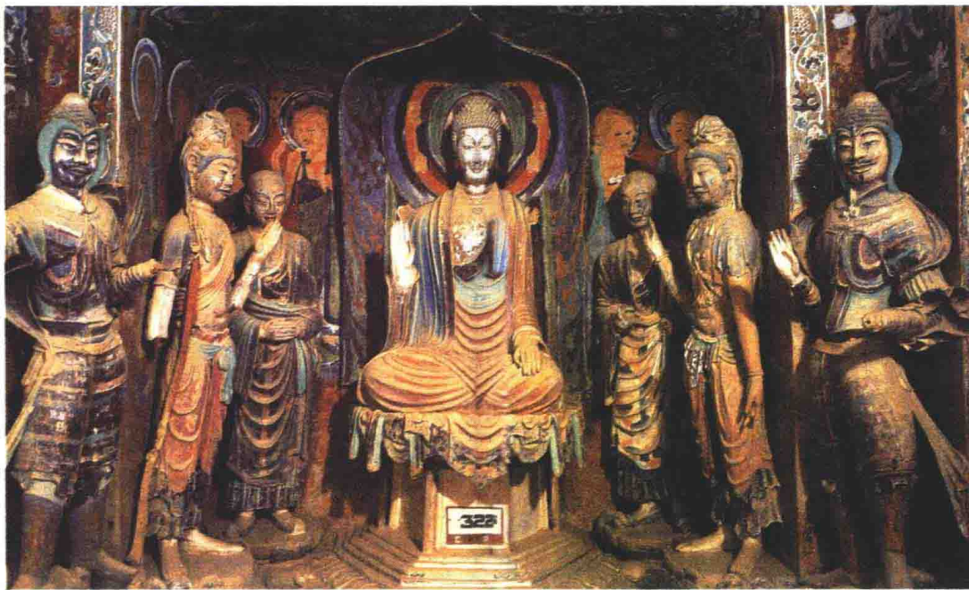
图3 莫高窟第322窟塑像