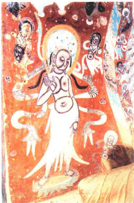
图 1-2 莫高窟第 272 窟 胁侍菩萨 北凉

犍陀罗，于是，犍陀罗就用古希腊罗马的造像技术创造佛像。这就形成了佛像的一种特殊的艺术风格。后来，印度佛教传入中国，这种造像技术也随之传入敦煌。