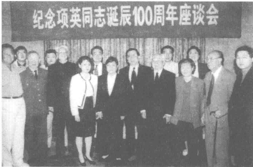
1998年，项英百年诞辰，中央领导与项英亲属合影

中央组织部部长陈云见项苏云在大礼堂张望着找爸爸，便过来领着她走到一排座位前，对朱德身边的项英说：“老项，这是你的女儿。”又转身告诉项苏云：“这就是你爸爸。”项苏云告诉记者，她当时只是瞪大眼睛看着眼前的这个人，想叫爸爸却叫不出口，因为对父亲感觉到又熟悉又陌生，她长到八岁才第一次见到爸爸啊！后来项英又从延安保育院将儿子项学诚接到中央组织部招待所，这样他同儿女们一起团聚了。