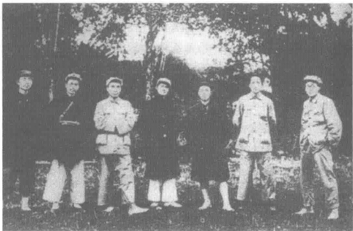
1931年11月，中央苏区中央局委员合影（右3为项英）

江岸工人俱乐部，由此开始了职业工人运动的生涯。1922年项英入党，项英这个名字是他入党后开始用的，一直到他牺牲。