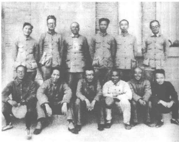
1938年9月,中共六届六中全会主席团成员合影(前排右2为项英)

从那以后,8月1日就成为工农红军及当今中国人民解放军的建军节,也成为国防教育的重要日子。