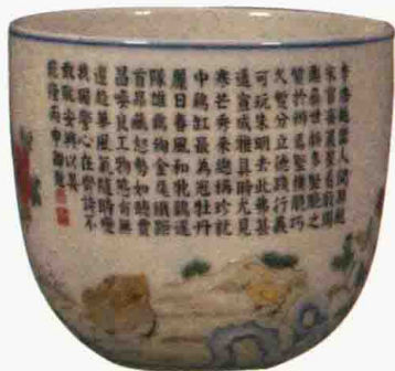
清乾隆 粉彩御题诗文鸡缸杯 口径 8.1 厘米 观复博物馆藏