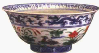
明宣德 五彩莲池鸳鸯碗 高 8 厘米 西藏萨迦寺藏