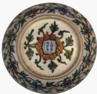
明嘉靖 斗彩缠枝莲纹盘 直径 22.4 厘米 故宫博物院藏