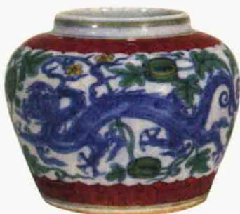
明成化 斗彩龙纹“天”字罐 高 13 厘米 日本东京国立博物馆藏