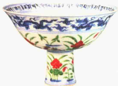
明宣德 青花五彩莲池鸳鸯纹高足碗 高 11.5 厘米 西藏萨迦寺藏

明代五彩多是用青花作为蓝色，再加上红、绿、黄、紫等颜色，构成五彩缤纷的样子。清代以后，五彩和其他彩瓷争奇斗艳，康乾盛世时期的一大发明是把五彩中的青花颜色去掉了，增添了釉上的蓝色。那时