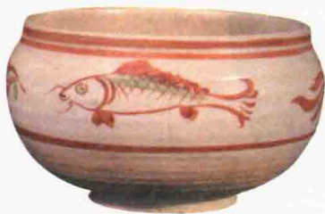
金代 磁州窑白釉红绿彩双鱼钵 腹径 15 厘米 观复博物馆藏

五彩是彩瓷中一个非常重要的品种，清代以前的所有彩瓷都可以统称为五彩。“五彩”并不是固定的五种颜色，而是多种颜色。跟“五”有关的成语，也多泛指，比如五光十色、五风十雨、五福临门等。