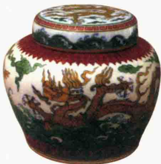
明成化 斗彩海水龙纹盖罐 高 13.1 厘米 故宫博物院藏