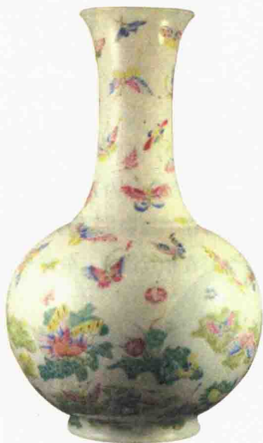
清晚期 粉彩百蝶瓶

这是一个清晚期民窑的百蝶瓶，器型是不带弦纹的赏瓶。上下翻飞的蝴蝶代表人们欢天喜地的心情。一般来说，光绪年间官窑的百蝶瓶上，蝴蝶都画得比较规范，大小也差不多，而且都是同一个状态。而这件上面的蝴蝶要自由得多，大小、形态也都不一。另外，这件东西还间或画了些花草，有表示蝴蝶落地的景象。