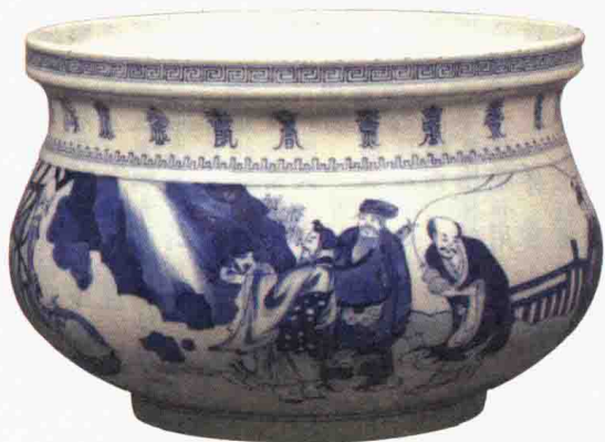
清康熙“八仙上寿图”青花香炉

这件东西最特殊的地方在于它的口。香炉的口一般是翻边的，这种盘口的非常少见。这可能是因为定烧的人或者工匠做了一种个性化处理。香炉的颈部写了一圈异形字，主要是“寿”字，还有“禄”字和“福”字，它们作为一种艺术装饰手段，也是很不错的。