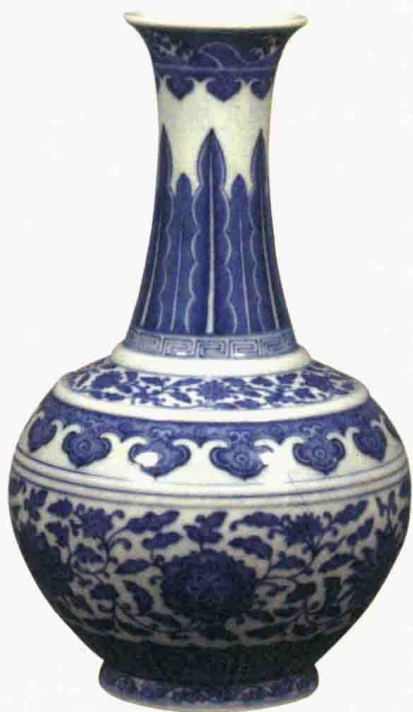
清道光 青花缠枝花卉纹赏瓶

这是一个清代道光年间的赏瓶。赏瓶原名玉堂春瓶，最早出现于雍正年间，现在全世界范围内写有“大清雍正年制”的赏瓶只有两件，都在国内。赏瓶是赏费用的，是当时宫廷发放的奖品。赏瓶有两种，一种是带弦纹的，另一种是不带弦纹的。这件东西在烧造时青花颜色控制得非常娴熟，颜色的深浅层次达到了非常高的水平，可以说滴水不漏。这件东西是官窑，因此在每一个时期基本上都能达到质量一致。