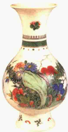
清康熙 五彩花卉纹瓶 高 20.3 厘米 观复博物馆藏