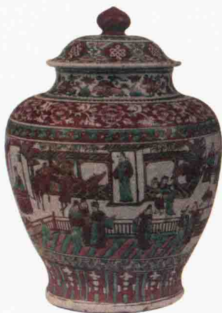
明晚期“大明赤绘”五彩楼阁人物盖罐 高 45.8 厘米 英国维多利亚和阿尔伯特博物馆藏