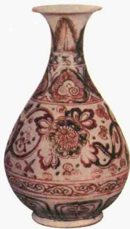
元代 红绿彩狮戏球纹玉壶春瓶 高 24.8 厘米 日本东京国立博物馆藏