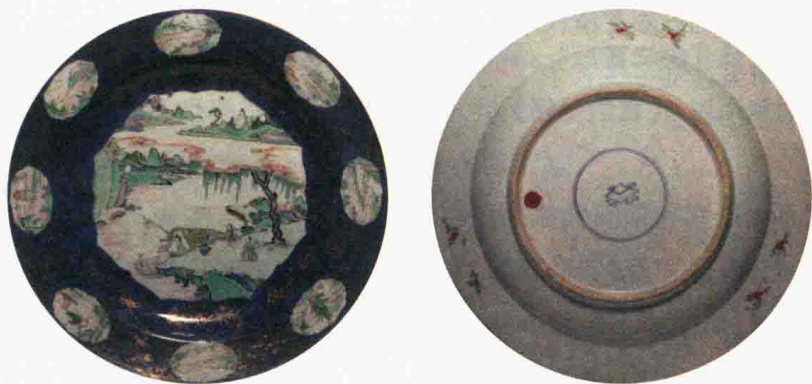
清康熙 洒蓝釉描金开光五彩渔家乐图盘 口径 44 厘米 观复博物馆藏

这是一块洒蓝釉描金开光五彩渔家乐图盘，主题图案是渔家乐。康熙时期经过初年的江山平定，人们的生活变得越来越富足。我们可以从这件康熙中期的瓷器当中，看到当时百姓生活的变化。它以蓝色为底色，中心