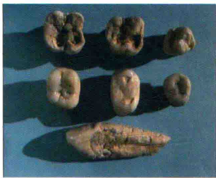
龙骨坡遗址出土的动物化石