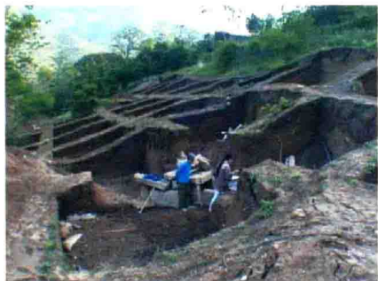
大溪遗址发掘场景