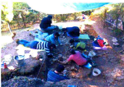
龙骨坡遗址发掘工作照