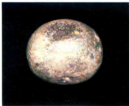
龙骨坡遗址出土最早的石器 —砸击石锤