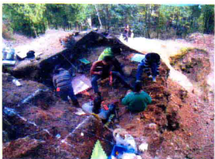
龙骨坡遗址发掘工作照