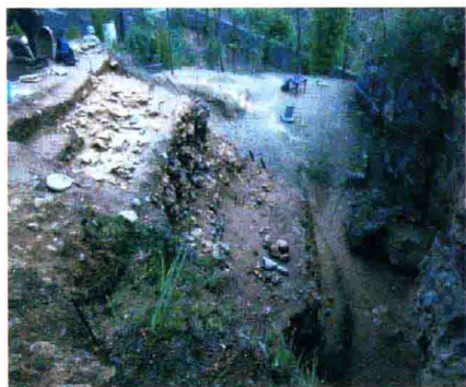
龙骨坡遗址发掘现场