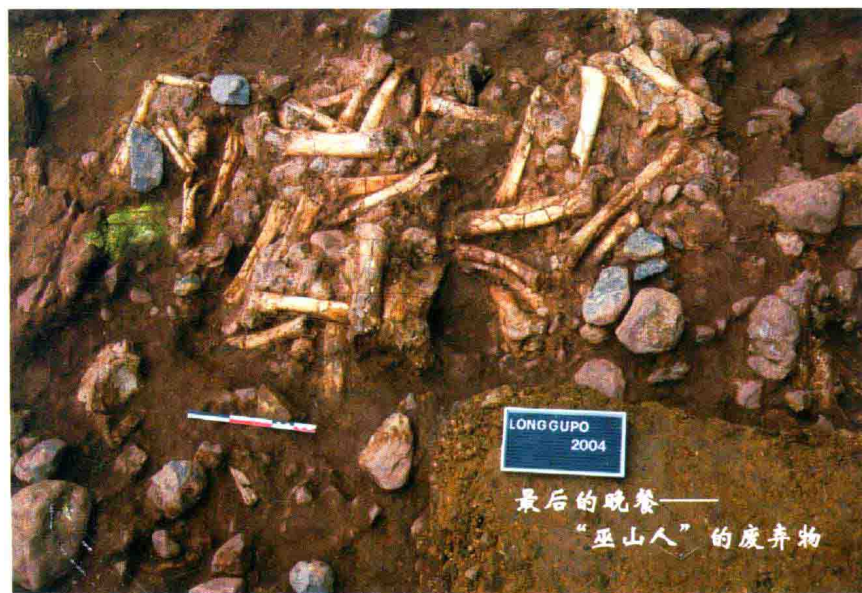
“巫山人”最后的晚餐