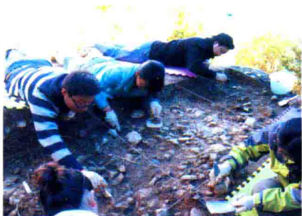
龙骨坡遗址发掘工作照