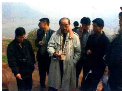
著名考古学家俞伟超先生 视察大溪遗址发掘工地