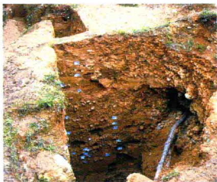
龙骨坡遗址发掘探方