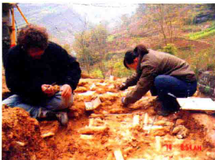
中法专家齐聚龙骨坡