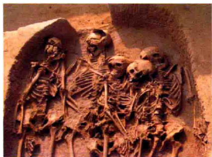
大溪遗址五人合葬墓