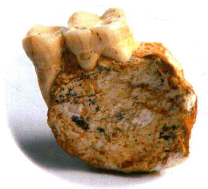
龙骨坡遗址出土的“巫山人”下颌骨白齿 —东亚地区时代最早，性状最原始的古人类化石