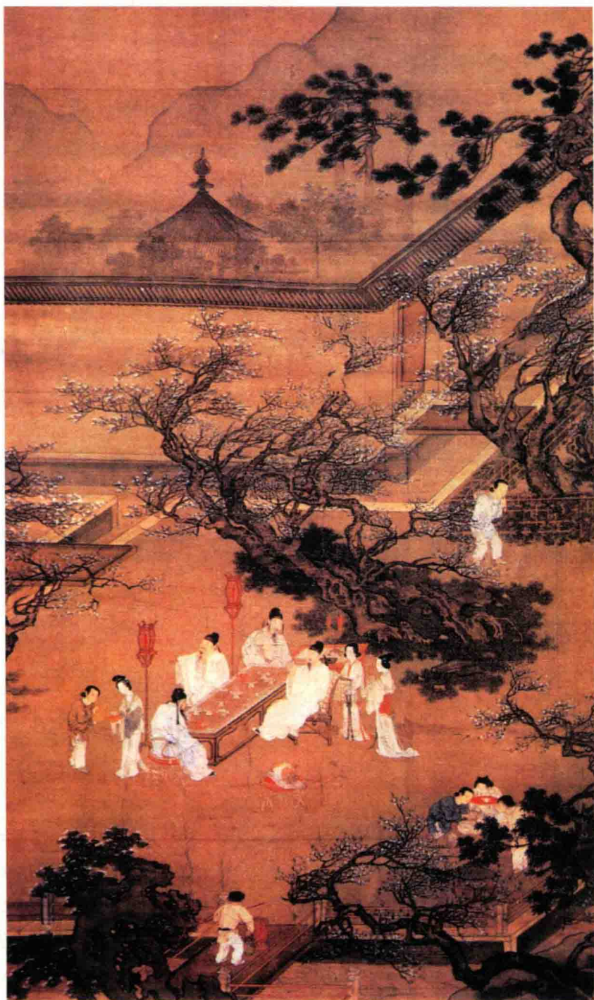
仇英《春夜宴桃李园》