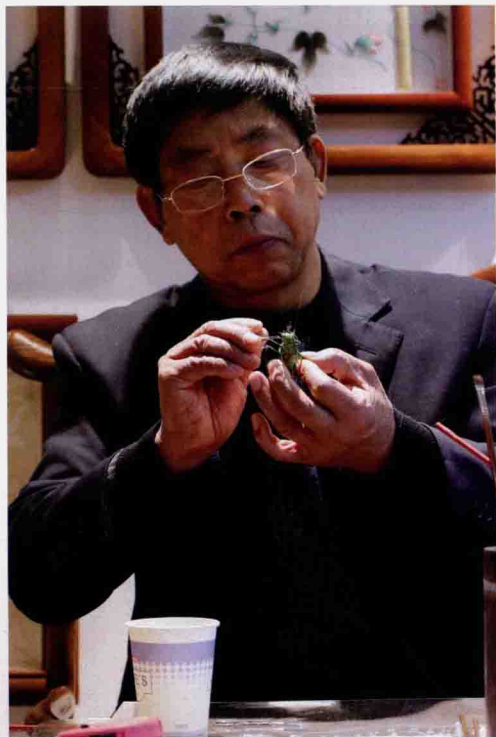
河南省工艺美术大师