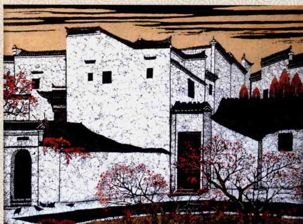
《徽州民居》系列之二