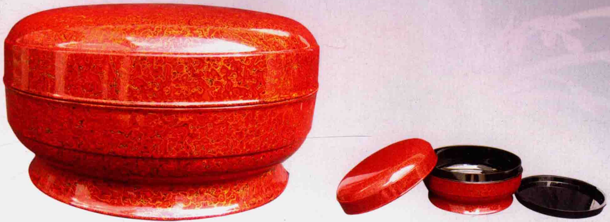
《红金斑菠萝漆大圆盒》