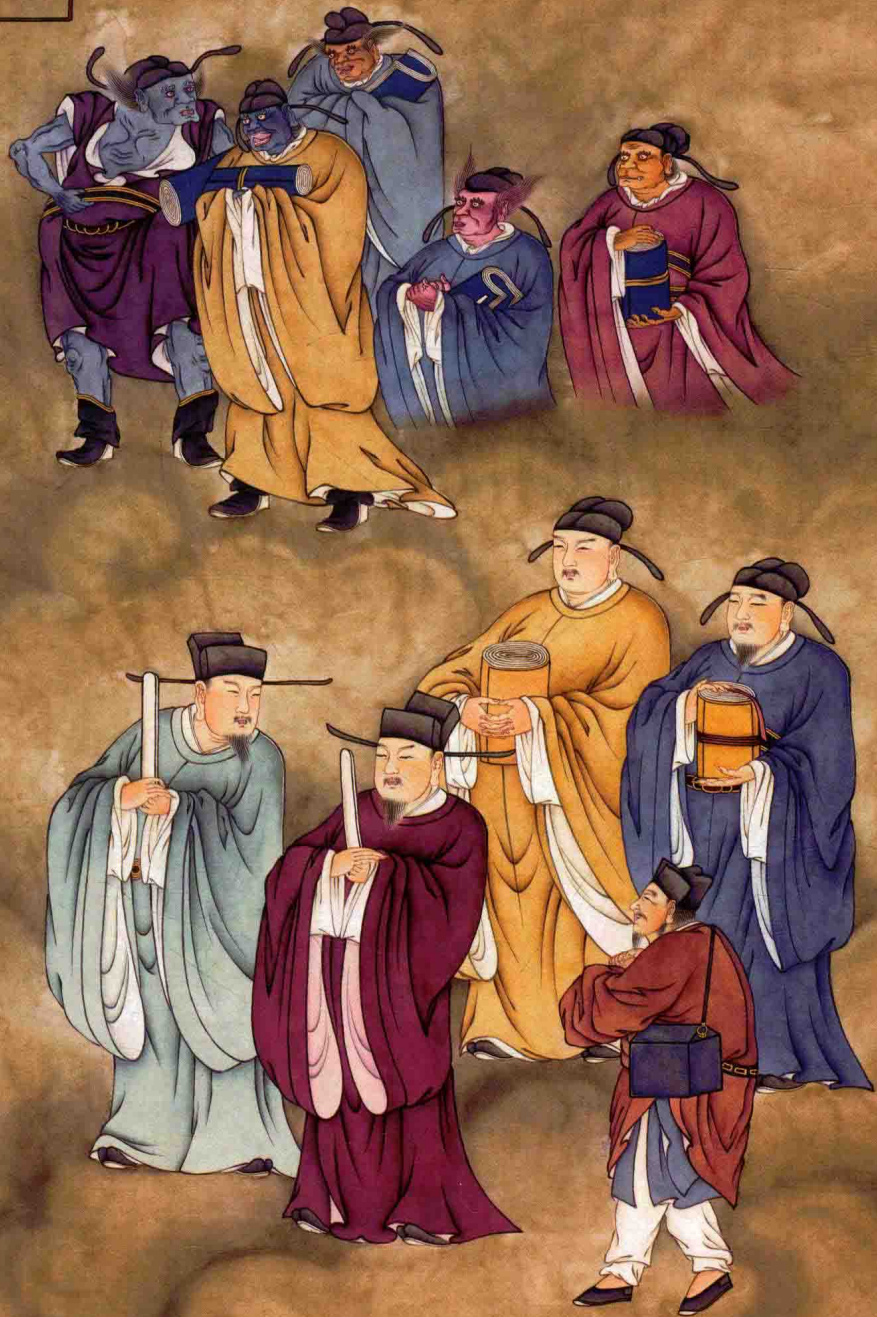
◎ 第四十 天曹掌祿主算判官諸司判官等衆 2000年 紙本設色 140cm X 70cm