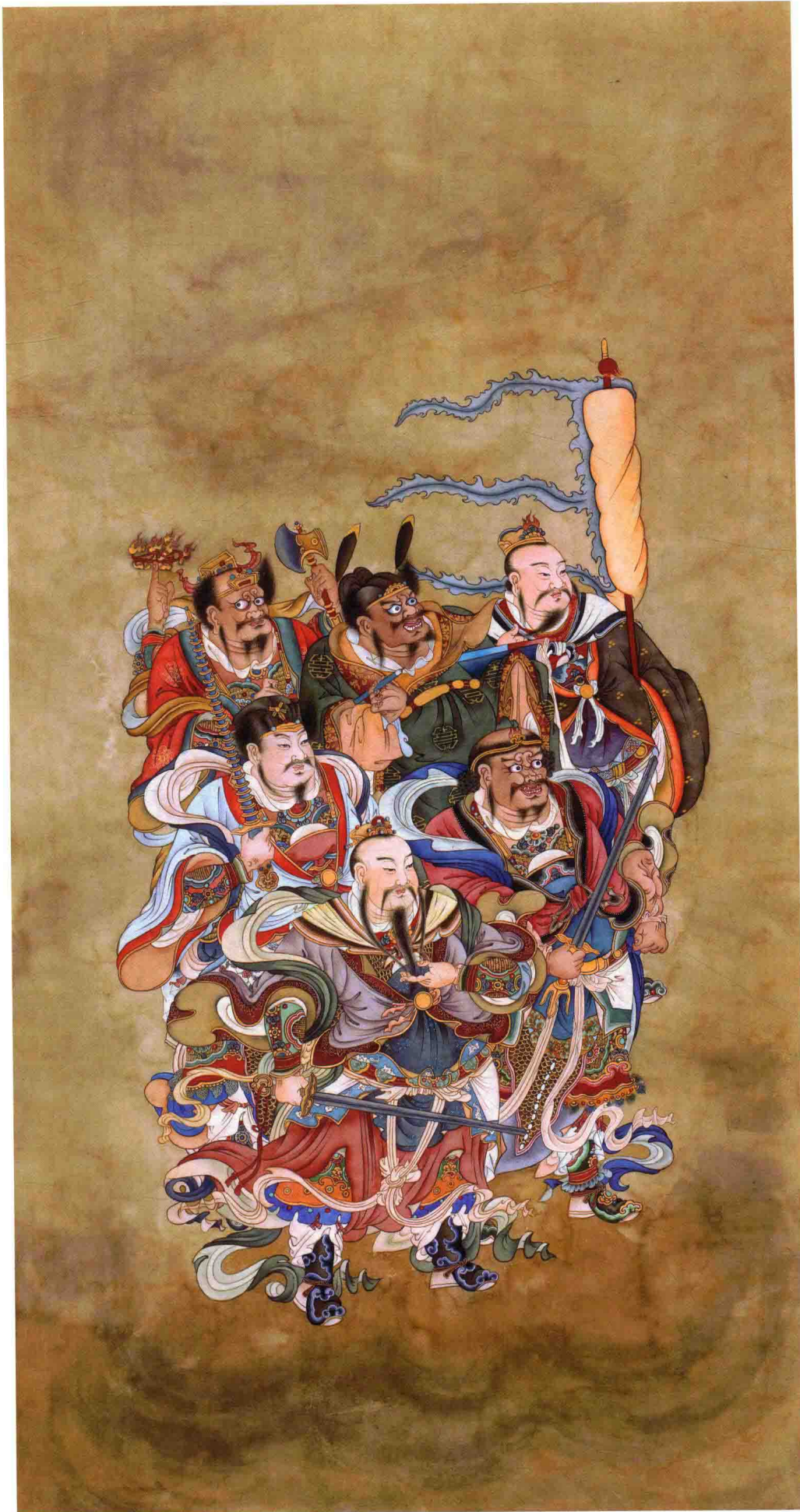
◎ 能具持清净戒 2000年 纸本设色 150cm × 68cm