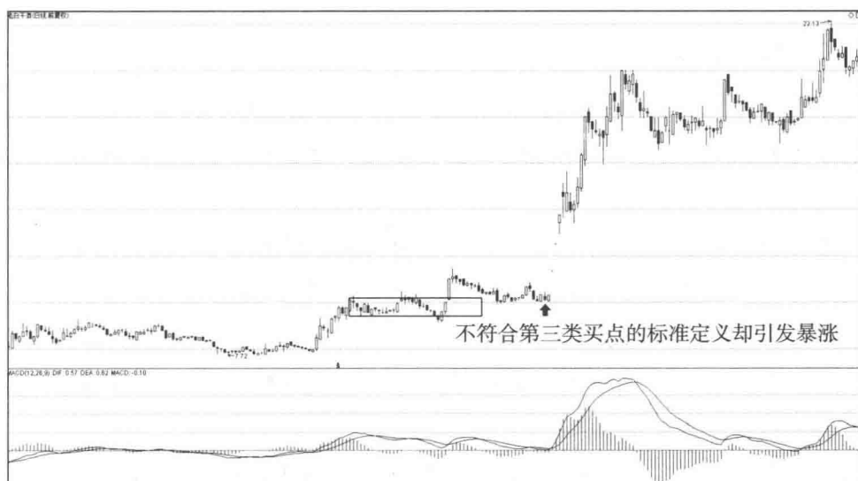
图1-1-2 老白干酒（600559）2014年10月前后日线走势图

请看图1-1-2，向上箭头处虽然不符合第三类买点的精确定义，回抽进入了中枢区间，只构成了中枢震荡的买点，但之后却引发暴涨。