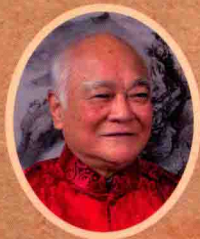
国医大师 李济仁 亲自主审