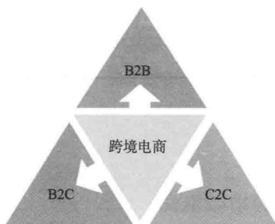
跨境电商的三种模式

跨境电商有三种模式，分别是 B2B（企业对企业）、B2C（企业对消费者）、C2C（个人对消费者）。而跨境微商，其实就是针对 B2C（企业对消费者）、C2C（个人对消费者）这两种模式而言的（本书所讲的知识，基本倾向于这两种模式）。所以，跨境微电商的定义