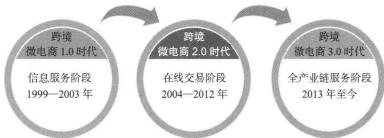
跨境微商发展的三个阶段

在移动互联网已经非常发达、国家力推“互联网+”战略、传统企业风雨飘摇的时代背景下，跨境微商以自身的优良特性，正在以迅雷不及掩耳之势发展着。它作为许多传统企业和个体商家寻求转型的突破口，势必会爆发出巨大的正能量，帮助企业和个体商家完成商业逆袭。