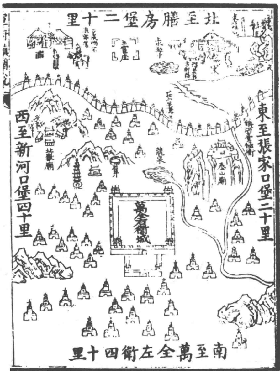
图二 《宣大山西三镇图说》中万全右卫舆图

目前也有对体系内古城做单独调查研究的成果。如北京大学历史文化研究所曾组团对张家口堡进行调查，但无测量数据 [1] 。胡明《张家口堡城池考》在实地调查的基础上，探讨了张家口堡之“堡子里”的形制 [2] 。近年来较多学者开始用聚落形态的视角