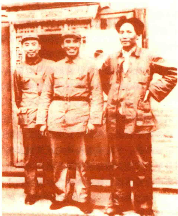
❖ 毛泽东、朱德、周恩来在延安

周恩来长期在国民党统治区主持统战工作，并兼管秘密战线的斗争，经常奔波在重庆与延安之间。《史记·鲁周公世家》称周公“一饭三吐哺，一沐三握发”，是说周公为周王朝披肝沥胆工作的情形。用这两句话形容周恩来为党忘我工作的情形一点也不为过。自1937年以后，周恩来就为抗战大计，马不停蹄地奔走在重庆与延安之间。在大生产运动中，他从来没有因为自己事务多，常年在奔波为借口，仍然和其他领导人一样投入大生产运动。在延安革命纪念馆的展厅里，陈列着一架纺车，它是当年延安军民大生产运动中，周恩来用过的纺车。他纺纱技术高，质量好，在参加比赛时还得了奖。在国共合作期