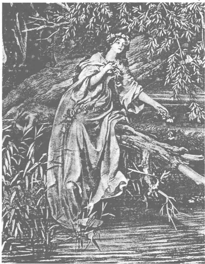
奥菲利娅（见“哈姆莱特”）