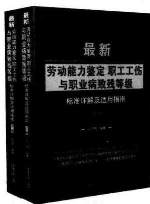
《最新劳动能力鉴定 职工工伤与职业病致残等级 标准详解及适用指南》(上、下册)