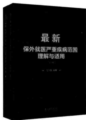
《最新保外就医严重疾病范围理解与适用》 (上、下册)