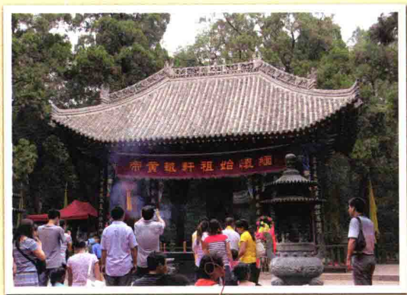
清明节，世界各地的华人来黄帝陵祭拜黄帝。

根据《二十五史新编》记载：黄帝可能确有其人，是父系氏族时期中原地区的一位部落联盟长。他通过战争，使中原各部落实现了联合，并做了许多好事，因而在古人的口传历史中占有重要的地位。