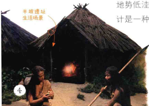
半坡遗址 生活场景

河姆渡遗址中的房子与半坡遗址的不同，长约23米，宽约3.2米，为桩上长屋，可分成多间，分开住人。此处建筑建在一片沼泽地的边缘，地势低洼潮湿，从遗址成排的木桩来看，估计是一种干栏式住宅建筑。这种建筑是用木头或竹子做桩建成一个高出地面的基座，再在其上建筑房屋。这样既可以避免风雨的危害，又能防止猛兽的袭击。