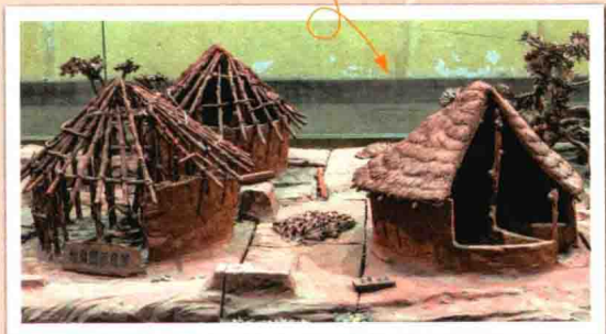
半坡人的房屋模型

半坡遗址中的房屋顶部较平。房屋用几根木柱支撑起来，让人惊奇的是，房屋的木柱都非常粗，有些直径达45厘米。那时候，没有金属器具，人们如何砍伐那样粗的木头呢？另外，房屋使用的板材，保守估计长度可以达到2米，宽度达10~15厘米，厚度是1.5~2厘米，他们是怎么加工出来的？考古学家确定不了，但我们的祖先确实已经把木头制成了木板，这真令人惊叹。