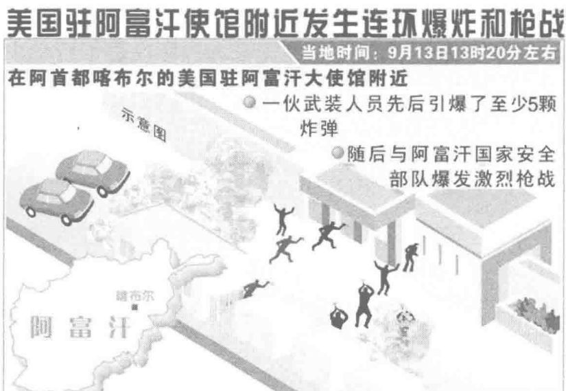
美国驻阿富汗使馆附近发生恐怖袭击示意图

服丧,多达 18 个恐怖组织发出唁电。巴基斯坦塔利班成为“复仇先锋”。拉登死后,巴基斯坦塔利班率先发布视频,声称“将为拉登雪恨”,并迅速制造系列大案:5 月 13 日用“人弹”袭击巴西北边防军训练中心,造成 80 多人死亡、150 多人受伤;20 日炸毁北约油罐车队和美领事馆车辆;23 日夜袭卡拉奇海军基地,使巴遭受类似 2008 年印度“孟买案”的恐怖袭击;6 月 25 日突袭南瓦济里斯坦警察局。2011 年,巴基斯坦塔利班熬过美巴围剿的困难期,实力逐步恢复。2010 年巴基斯坦遭受巨大洪灾,巴军抽调大量兵力参与救灾和重建,未应美国要求出兵围剿北瓦济里斯坦,巴基斯坦塔利班得以喘息。同时,巴基斯坦塔利班与巴境内的“虔诚军”、“穆罕默德军”、“简戈维军”和“圣贤军”等极端组织勾连密切,使得巴基斯坦塔利班在巴全境内具备强大的实力。