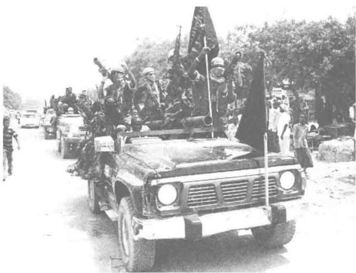
索马里反政府武装“青年党”一部

下,“青年党”产生在国内和近邻搞恐怖袭击的强烈愿望,期望借此提升士气,渡过难关。10月18日,该组织趁肯尼亚政府官员与索官员磋商联合打击事宜时,在索外交部官邸附近实施自杀式汽车炸弹袭击,造成至少15人死亡。10月24日,该组织用手榴弹袭击肯尼亚首都内罗毕一家舞厅,至少使14名肯尼亚人受伤。11月3日,“青年党”发表视频称:“由于肯尼亚部队非法进入索马里南部地区,决定建立抵抗体系,并派武装人员到肯尼亚境内发动无限期的战争。”此外,“青年党”积极开展“自救”措施,通过在海外募资、在统治辖区强行收税、大搞军火走私和劫持等犯罪活动扩充财源;同时,向缺粮地区发放食物、水和医药笼络民心,修补与部族间的关系,恐怖实力并未从根本上受到削弱,短期内仍具相当战斗力。