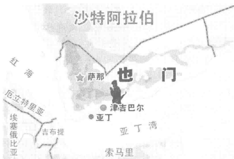
“基地”组织也门分支分布图

也掌握在萨利赫亲戚手中,动乱已冲击美国在该地区的反恐部署和地区反恐机制。另一方面,也门内乱加速“半岛分支”与部落势力联合。部落支持是“半岛分支”的生存基础,也门局势混乱,各方争权夺利,部落不会轻易放弃对“半岛分支”的庇护。这其中既有部族性格使然,也有经济因素影响。也门南部地理偏僻,民众思想保守,看重部落荣誉和尊严。他们的风格和传统道德观与阿巴部落类似,视尽责保护同宗客人为义务。“半岛分支”也常通过与部族联姻和施以当地民众小恩小惠赢取支持。也门石油资源开发几近枯竭,萨利赫政府对各部族的财政支持大为减少,部落支持“半岛分支”即可直接获利,也可借机向当局提高要价捞取实惠。此外,美近年在也门南部搞“定点清除”误杀甚多,民怨四起,部落民众与恐怖分子走近也有一定社会基础。为应对美国在也门新实行的特种反恐作战,部落也开始与“半岛分支”联手。