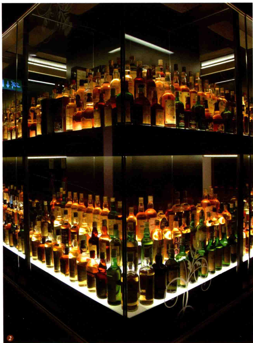
图2. 帝亚吉欧苏格兰威士忌收藏馆内展品一隅