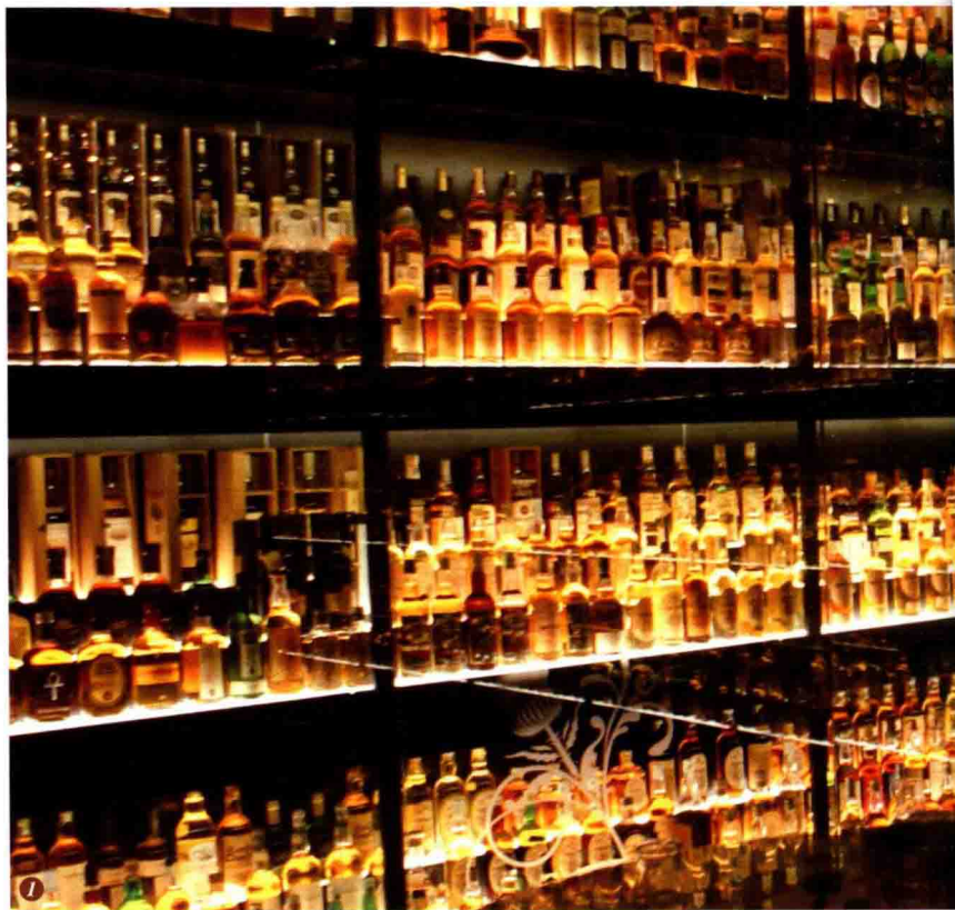
图1. 位于爱丁堡城堡脚下的苏格兰威士忌体验中心内帝亚吉欧收藏馆内展品一隅