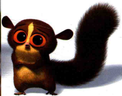
《马达加斯加》里的狐猴，毛发非常精细，但是还是和真实的狐猴不同，外表充满卡通感，夸大了狐猴的眼睛，填上了眉毛，赋予了拟人化的表情，变得更加可爱。

动画中的“写实”是相对而言的，也要经过选择、归纳、提炼及取舍而达到具有典型性、概括性和综合性的“真实”。有时候过于写实，反而没有起到好的效果。越接近真实，就会让人更多地去质疑它为什么还要存在，丧失了动画独有的魅力——夸张的造型、表情、动作。不拘泥于现实，强烈的娱乐性和喜剧色彩比真实性更吸引眼球。因此好多三维动画并不追求完全的写实，而是将抽象与真实结合。例如《冰河世纪》，一方面将牙齿做得逼真，而毛发的质感、眼睛的细节等又被简化了，每一个角色都有拟人化、风格化的表情与动作。卡通风格极大地拓展了对角色表现的自由度，使造型更接近角色的“内质”。