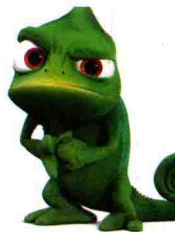
变色龙的写实到卡通化的设计，中间的角色外形高度简化，概况，不表现皮肤质感。右边的角色比前者稍微写实一些，材质表现细腻，但外形依旧夸张并做了拟人化的处理。