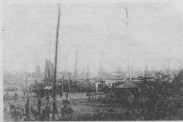
开港前营口码头“舳舻云集，日以千计”

近代初，帝国主义列强纷纷闯进营口，设领事馆，立海关，开银行，办“洋行”，办工厂，驻军队，肆无忌惮地倾销商品，掠夺资源，奴役人民，激起营口人民反帝爱国运动浪潮。1900年春夏之交，辽宁地区继山东、河北之后，义和团活动迅速发展起来。营口义和团是辽宁的重要据点。他们驻在西大庙、老爷庙、火神庙内，以西大庙为大本营，传授拳术，操练本领。从此，义和团活动遍及营口城乡。他们将外国侵略者视为最凶恶的敌人，英勇顽强，巧妙地打击敌人。1900年农历八月初四是俄国皇后的生日，义和团借机主动出击。八月四日黎明，驻扎在各庙里的“义和拳”和“红灯照”整队出发，到三义庙（站前区中兴里处）会师。他们头裹红布，腰束彩带，手持刀枪，浩浩荡荡地从西往东进发，途中高喊口号：杀洋人，烧教