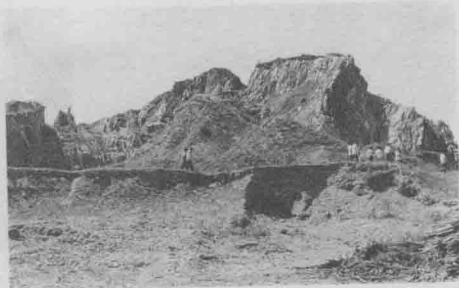
金牛山古人类遗址全景