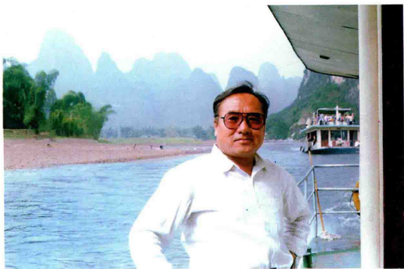
漓江行舟观奇峰(桂林)