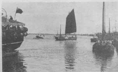
日军船只在辽河上横冲直撞