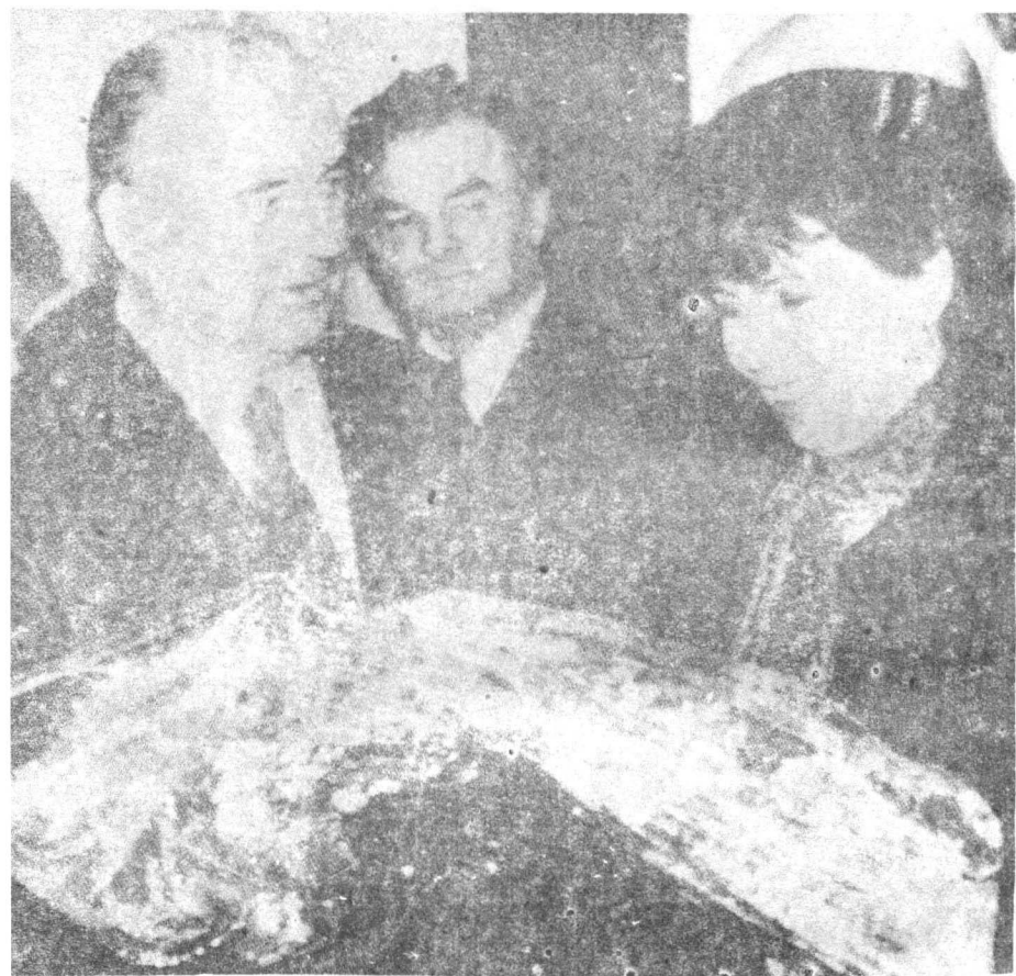
1984年12月，戈爾巴喬夫及其夫人賴莎訪問英國。圖為接受公眾獻花。