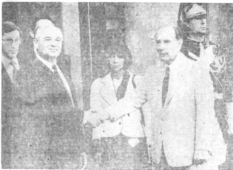
1985年10月戈爾巴喬夫出訪法國，密特朗總統舉行歡迎儀式