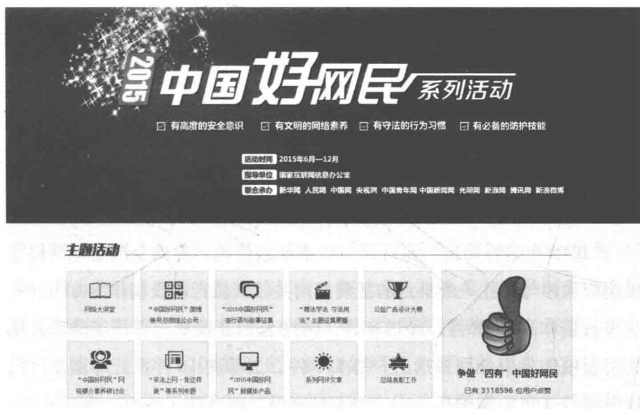
《2015 中国好网民》专题页面截图

“2015 中国好网民”系列活动，从 2015 年 6 月开始陆续启动，一直持续到 2015 年底，时间跨度长，范围广，力度强，影响大。举办“中国好网民”系列活动旨在贯彻落实习近平总书记有关重要讲话精神，充分发挥网络文化活动在网络社会治理中滋养人心、凝聚力量的作用，通过倡导文明健康的网络生活方式，培育崇德向善的网络行为规范，引导广大网民争做中国好网民，推动网络空间进一步清朗起来。