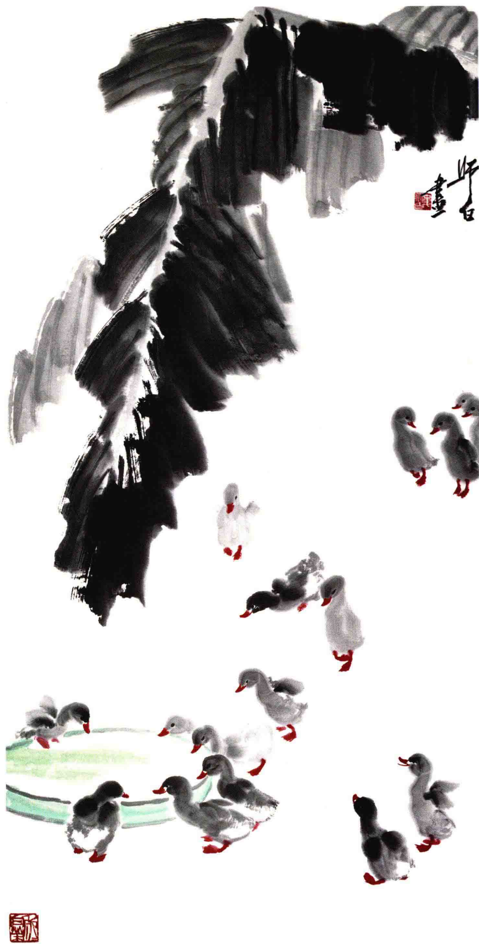
芭蕉小鸭 135cm X 66cm