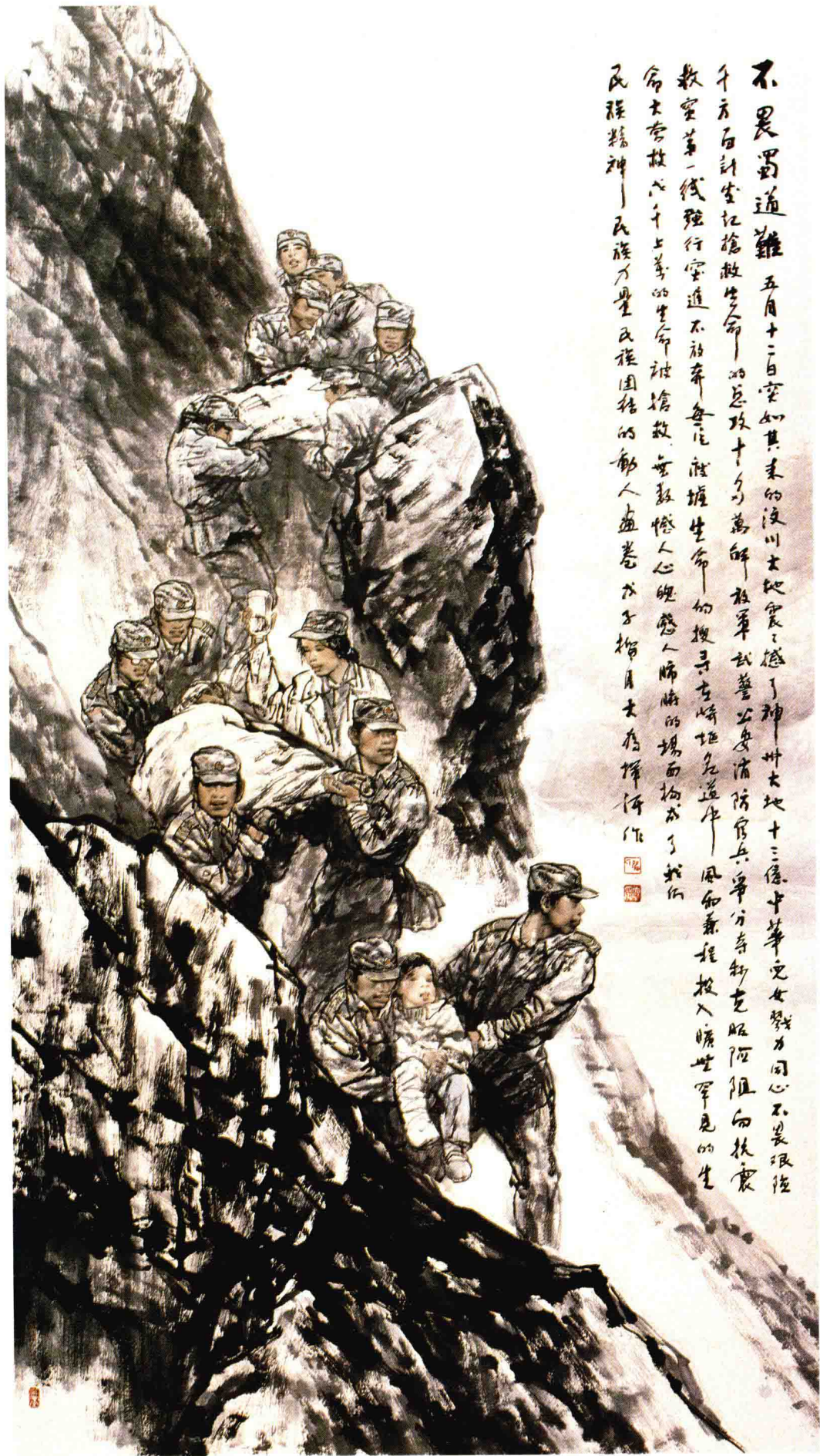
不畏蜀道难 290cm X 145cm

不畏蜀道难 五月十二日突如其来汶川大地震，撼了神州大地十三亿中华儿女戮力同心不畏艰险 千方百计坐视抢救生命——的总攻十分万解，解放军武警公安消防官兵争分夺秒克服艰险而抗震 救灾第一线逆行空道不放弃，每位救援生命的的搜寻在崎岖危道中——风和兼程投入旷世罕见的生 命大营救，成千上万的生命被抢救，无数颗人心魄感人心肺的场面构成了我们 民族精神——民族力量及团结的动人画卷，刘大为挥笔作