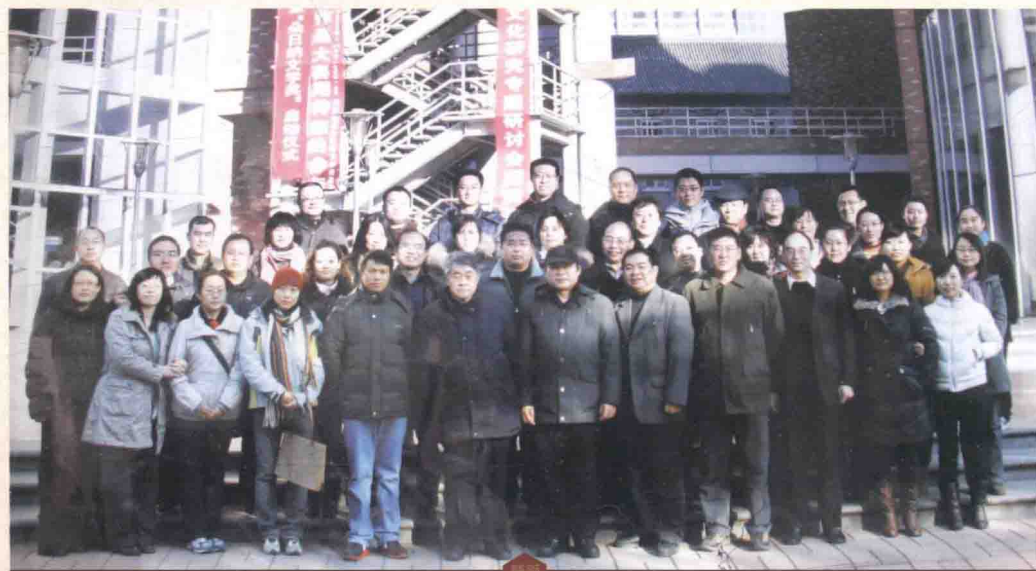
第四届浑沌学与语言文化研究专题研讨会参会人员合影