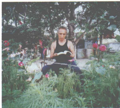
وىلىپىز ئاڭ مەسلىھەتچى ئۆمەر ۋەلىئاخۇن مەسلىھەتچى مەسلىھەتچى ئۆمەر ۋەلىئاخۇن مەسلىھەتچى ئۆمەر ۋەلىئاخۇن