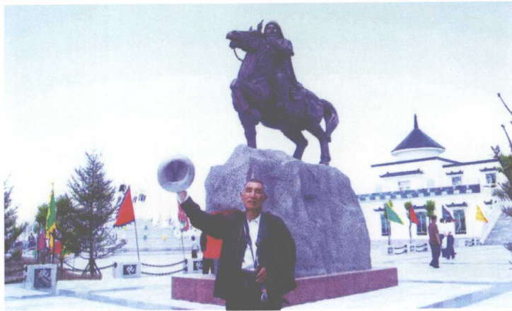
پسرخېلى، وختمنه علم وسره يام پلېنم عيسون لار سيمه ۱ پوهنيزه ټولنيزو علومو پوهنځي علم لار