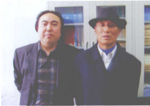
علم، پلېنم محقق علم پوهنيزه علوم پلېنم پلېنم علم لار پلېنم علم لار