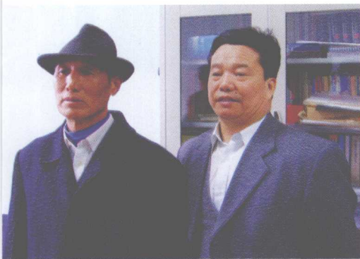
علم، پلېنم ( وختمنه ) پوهنيزه پلېنم دست پوهنيزه ټولنيزو علوم پوهنځي علم لار