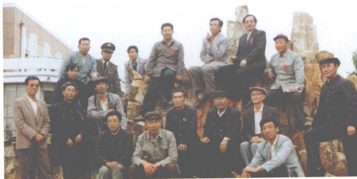
علم، تحقيق وسائر علم، باحث، وپښتنو پوهنځي ۰۶ ډله علم، پوهنځي، وسائر علم، باحث، وپښتنو پوهنځي ۰۶ ډله علم، پوهنځي، وسائر علم، باحث، وپښتنو پوهنځي ۰۶ ډله