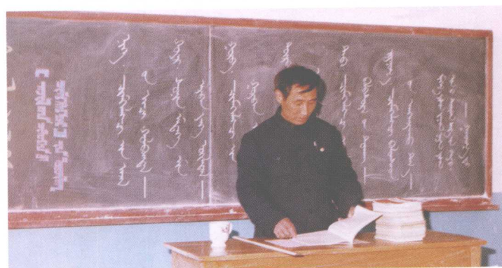
پښتانه، پوهنځي، وسائر علم، پوهنځي، وسائر علم، پوهنځي پښتانه، پوهنځي، وسائر علم، پوهنځي، وسائر علم، پوهنځي پښتانه، پوهنځي، وسائر علم، پوهنځي، وسائر علم، پوهنځي