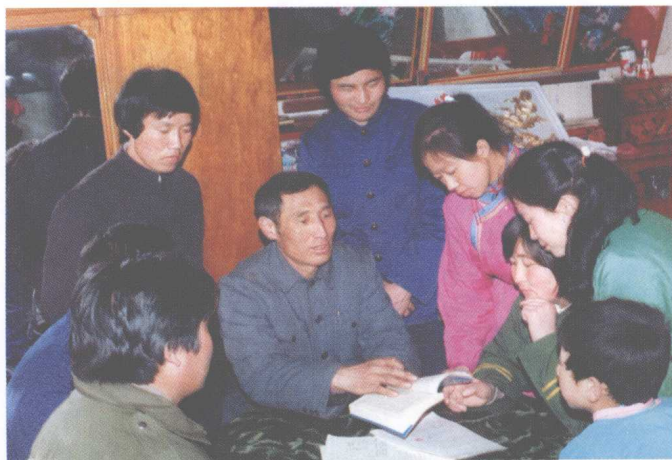
علم، پلېنم وسره پلېنم علم ټولنيزو علومو پوهنځي لار