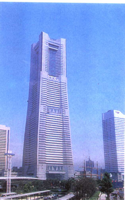
ランドマークタワーには近 未来的な雰囲気がある。日 本で一番高いビルだ らんまーく たうあー に は ちか 未来的な 雰囲気 がある。日 本で 一番 高い ビル だ ほん で いちばん たかい