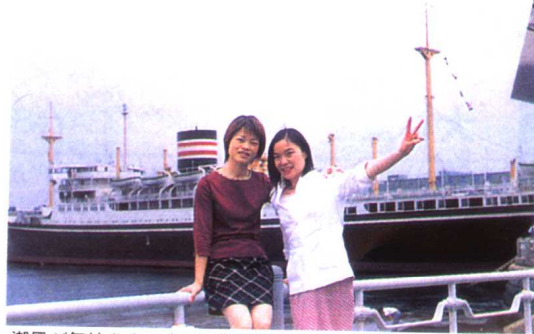
潮風が気持ちよい山下公園で。横浜港に浮かぶ氷川丸は、横 浜になくてはならない存在だ しほかぜ が きもちよい やまの 公園 で。よこはま 港 に うかぶ 氷川丸 は、よこ 浜 に なくて は ならない 存在 だ