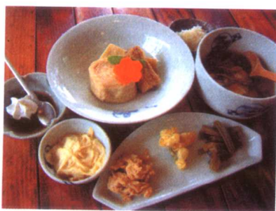
日光名物ゆばを使ったゆば料理の 数々。ゆばは日光のように良質な水が ある所でないとは作れない