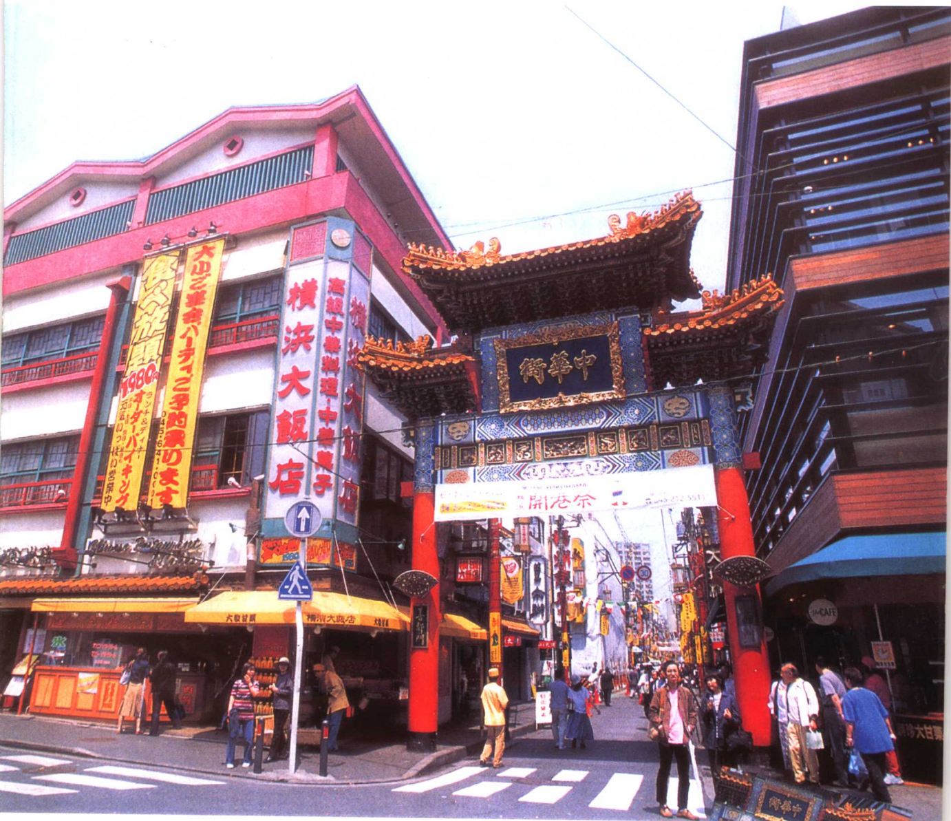
横浜の中華街は、世界的にも歴史あるチャイナタウンの一つ よこはま ちゅうが かい、せかいじきにも ありしち あり、ちゅうな たいうん の ひとつ