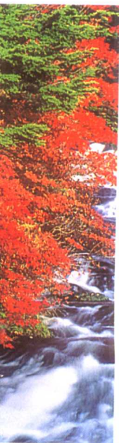
赤や黄色、オレンジ色に染まった木々。 秋の訪れを人々に伝える