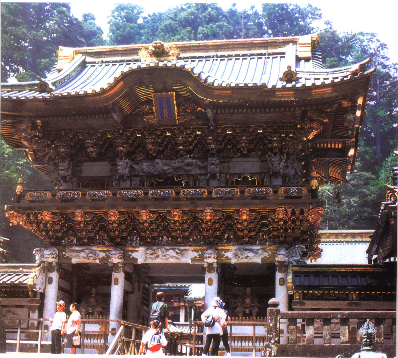
日光東照宮の陽明門。江戸時代、当時一流の工芸技術を持つ職人たちによって作られた