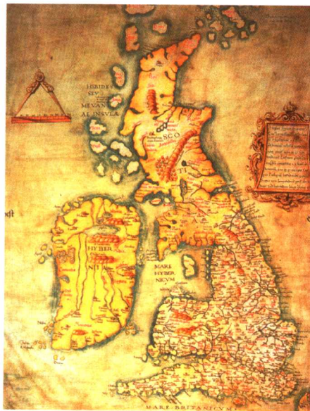
This is a medieval map of Britain in the year 600 AD.