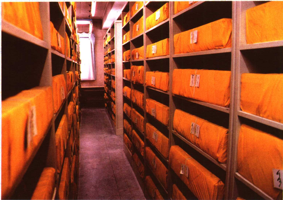
《丹珠尔》(1749 年北京木刻本)