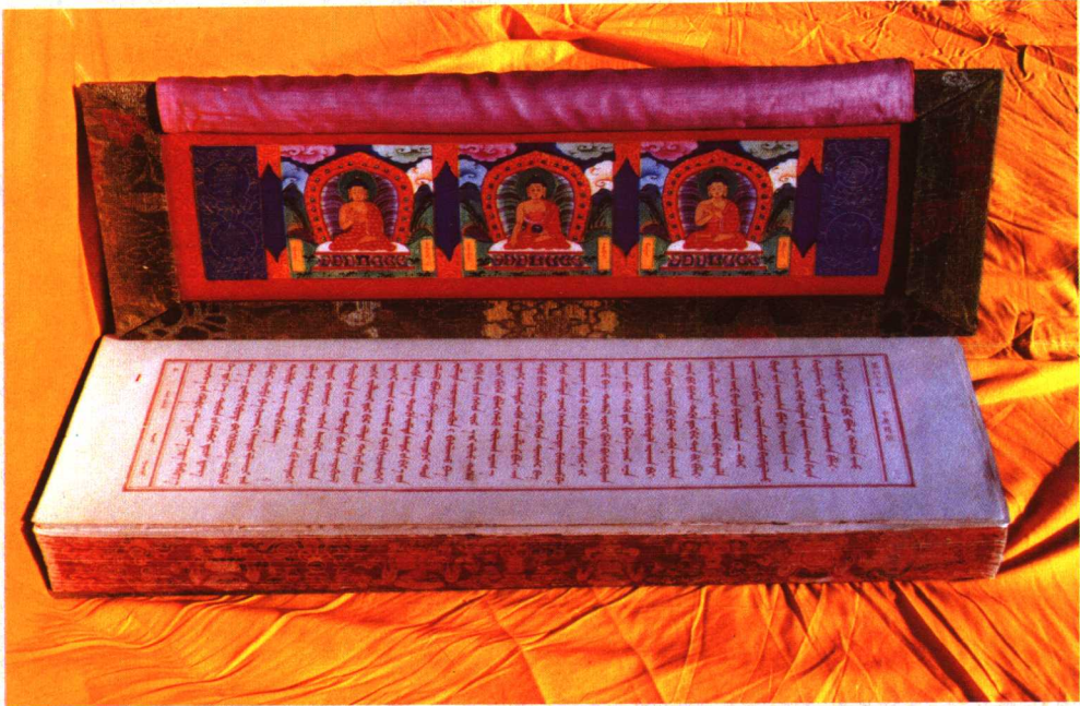
《Sutra》(1749 年) 的 Sutra 卷 (8)