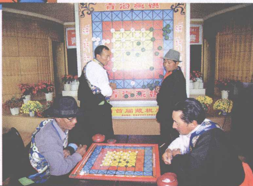
棋手们一争高低 འགྲིག་པ་ཚོས་རྒྱལ་པམ་ — འབྱེད་པ།

民间棋手们下棋比赛 དམངས་ཁྲོད་འགྲིག་པ་ཚོས་འགྲིག་ འདེད་བཞིན་པ། —