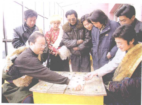
在基层选拔棋手 གཞི་རིམ་རུ་འགྲིག་པ་ འདེམ་གསེས་བྱེད་པ། ←