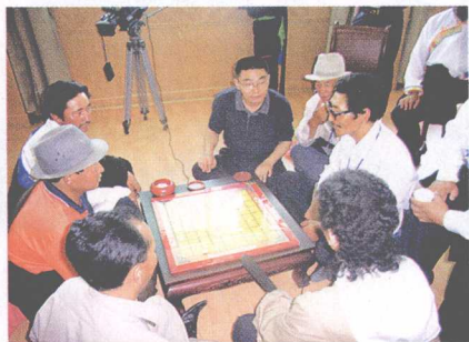
↑ 探讨棋艺 མིག་མངས་སྐྱུ་རྩལ་ བསྟོ་སྒྲེང་བྱེད་པ།