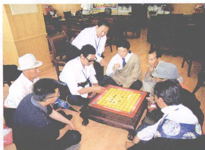
↑ 采访 བཅར་འདྲི་བྱེད་པ།