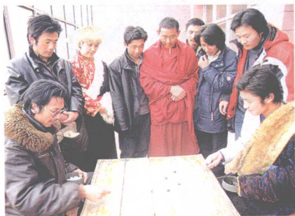
↑ 民间藏棋比赛 དམངས་ཁྲོད་དུ་འགྲིག་པ་ཚོས་ འགྲན་སྐྱར་བྱེད་པ།