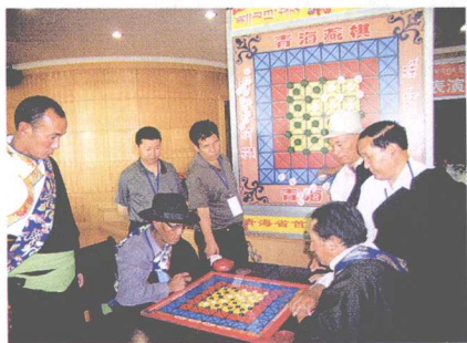
↑ 贵南县棋手和天峻县棋手比赛 ཀོས་ནན་རྫོང་གི་འགྲིག་པ་དང་ཐེམ་ཆེན་ རྫོང་གི་འགྲིག་པ་གཉིས་ གྲིས་འགྲན་པ།