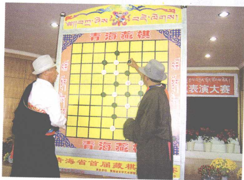
← 下“密芒”棋 མིག་མངས་འདེད་བཞིན་པ།