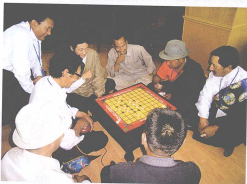
两队相遇 → འགྲིག་པ་ཕན་ཚུན་འཕྲད་པ།