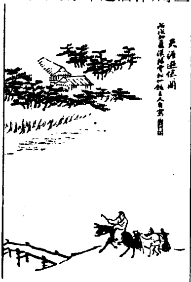
1-2 “断肠人在天涯”——思乡的主题

周嵩听了，不禁跪[guì]在母亲面前，哭道：“妈，恐怕不行啊！大哥虽然有抱负[bàofù]，名