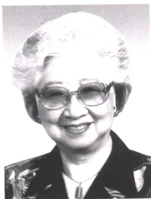
孔令仁 全国妇联第七、第八届副主席