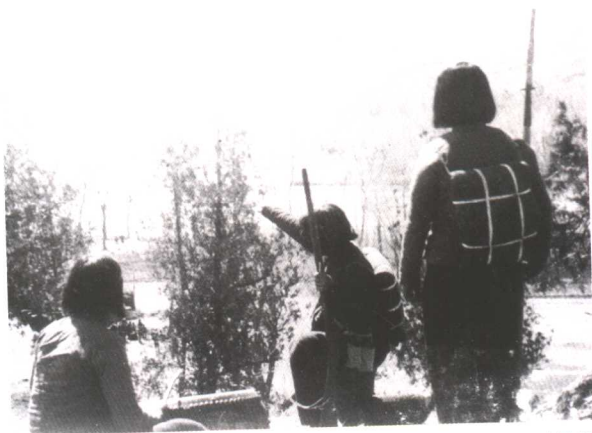
抗日战争时期，广大农村妇女踊跃支援前线