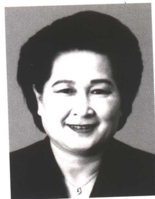
华福周 全国妇联第八届副主席