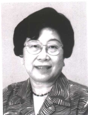
沈淑济 全国妇联第八届副主席