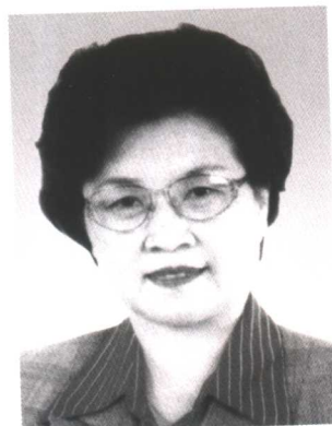
田淑兰 全国妇联第八届副主席