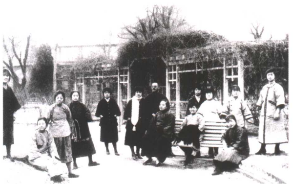
1923 年，天津达仁女校的女教师合影（左三为邓颖超）