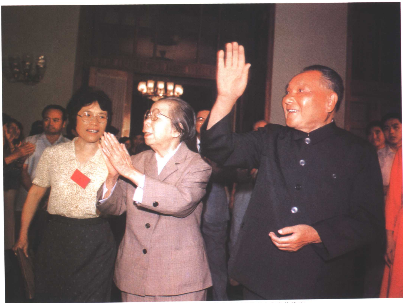
1988年9月，邓小平接见中国妇女第六次全国代表大会全体代表