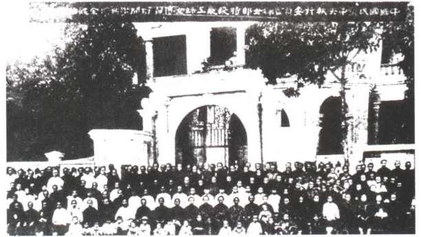
1925年7月28日，国民党中央党部妇女部特设省港罢工妇女传习所开学典礼