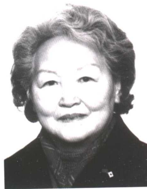
谢丽娟 全国妇联第八届副主席