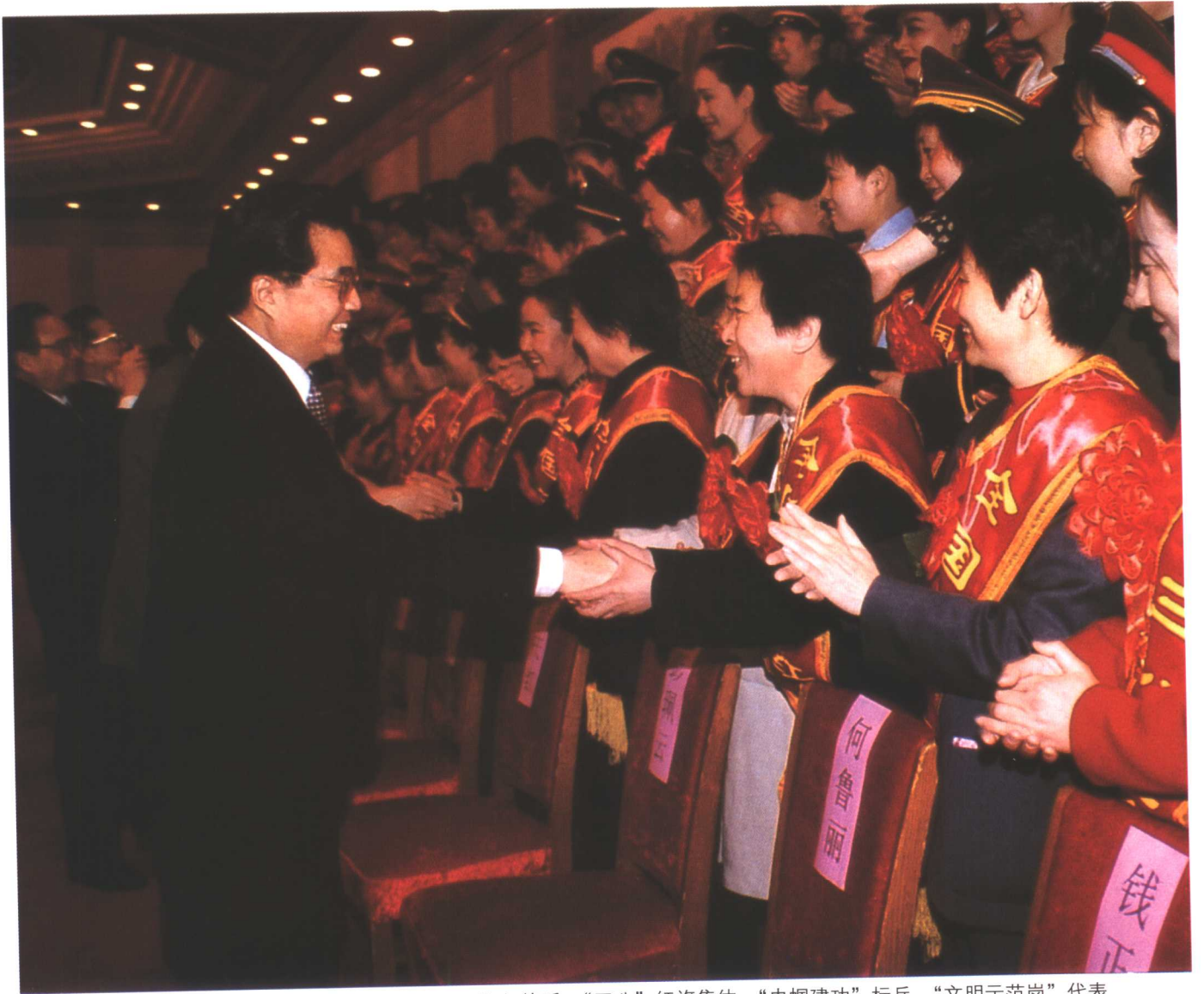
2000年3月7日，胡锦涛接见全国“三八”红旗手、“三八”红旗集体、“巾帼建功”标兵、“文明示范岗”代表