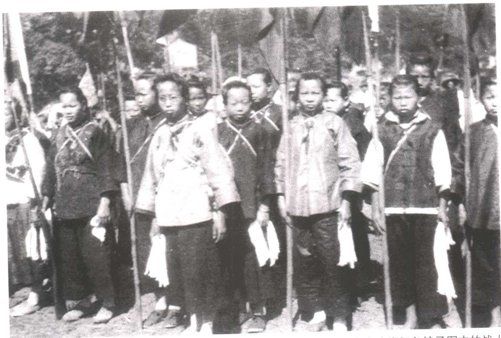
海南琼崖红色娘子军中的战士