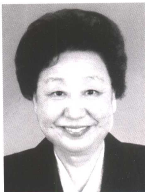
赵地 全国妇联第六、第七届副主席