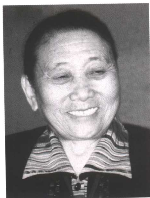
巴桑 全国妇联第八届副主席