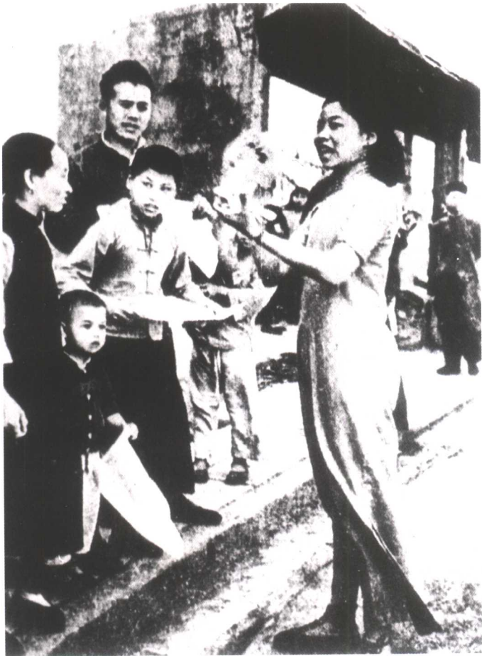
五卅运动期间，女宣传员在街头散发传单