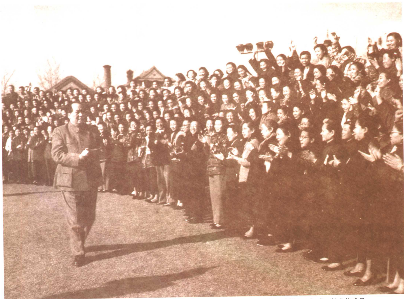
1956年，毛泽东接见全国工商业者家属和女工商业者代表会议的代表及港澳工商界妇女观光团的全体成员