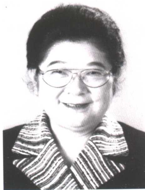
顾秀莲 全国妇联第七、第八届副主席