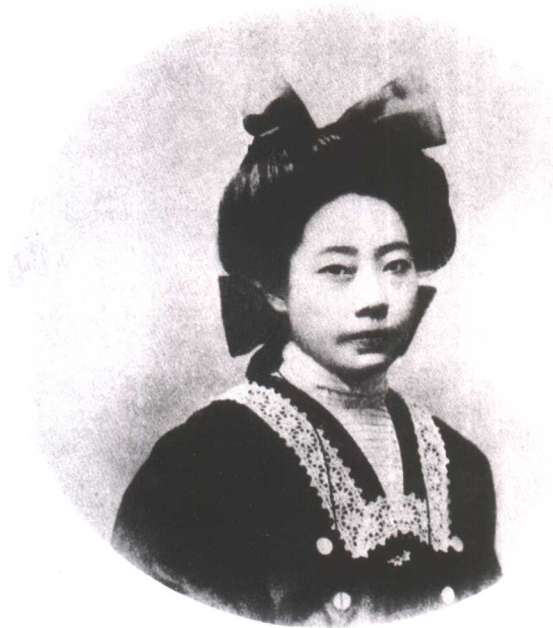
张昭汉，中国早期女报人，苏州大汉报主笔（1911年摄）