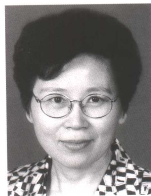
黄晴宜 全国妇联第八届副主席