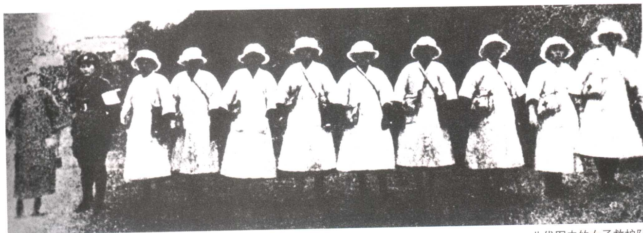
北伐军中的女子救护队