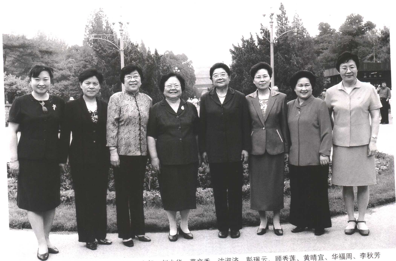
全国妇联第八届现任领导班子成员。左起：赵少华、莫文秀、沈淑济、彭珮云、顾秀莲、黄晴宜、华福周、李秋芳