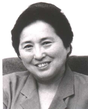
何鲁丽 全国妇联第七届副主席