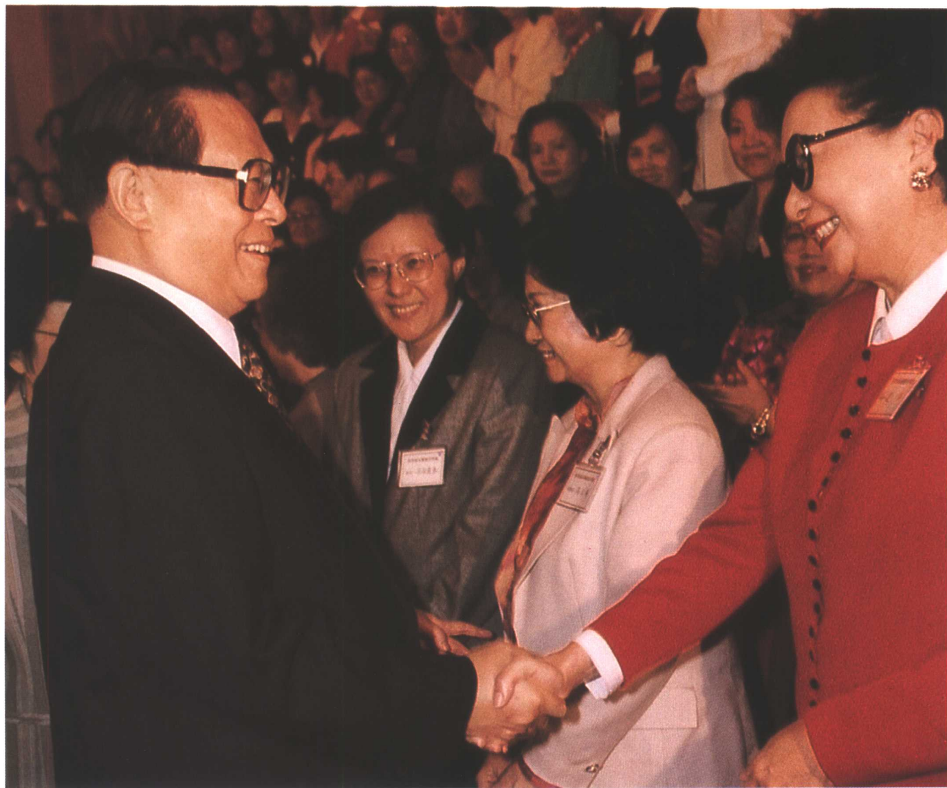
1996年9月30日，江泽民接见来京参加“共携手，迎回归”活动的香港妇女代表团