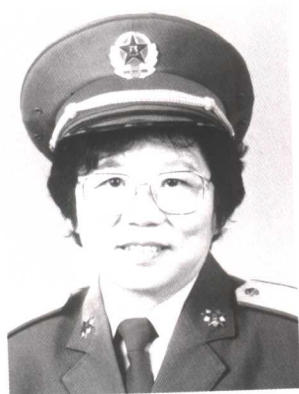
彭钢 全国妇联第八届副主席