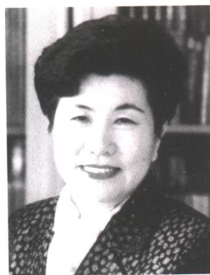
刘海荣 全国妇联第七、第八届副主席