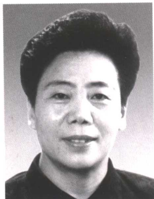
杨衍银 全国妇联第六届副主席