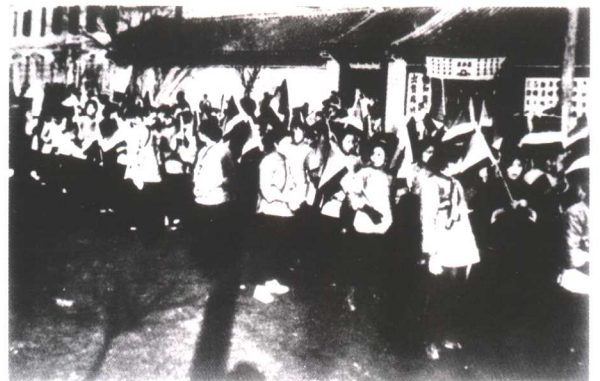
1919 年，北京爆发了五四反帝爱国运动。图为北京女学生走上街头参加示威游行