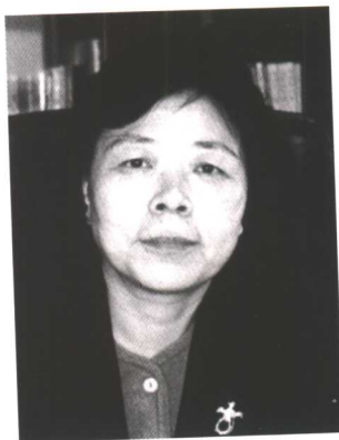
刘雅芝 全国妇联第八届副主席