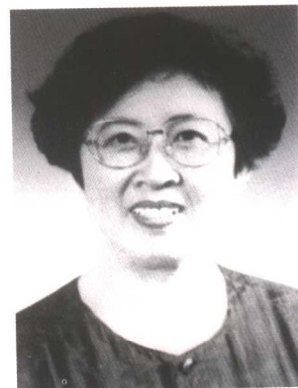
钱易 全国妇联第八届副主席