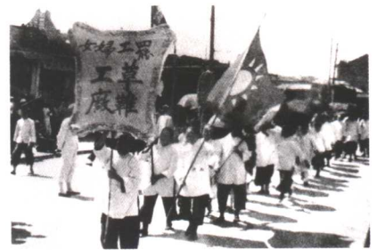
1926年省港大罢工期间，香港有13万罢工工人及工属回到广州，其中妇女达1.3万余人。图为草鞋厂女工在游行